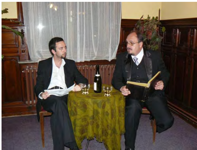
Městské muzeum a galerie, Ottendorferův dům