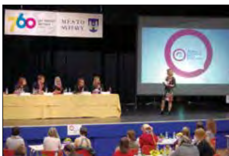
Konference Ženská energie pro politiku