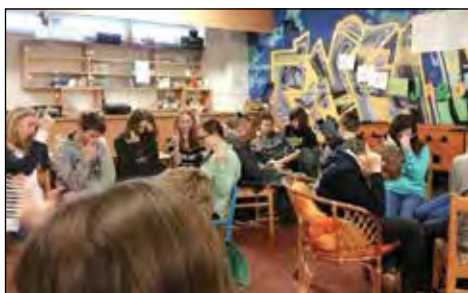
Jak předcházet závislostem - setkání žáků ZŠ T. G. Masaryka v nízkoprahovém klubu Díra