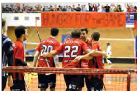
Čtvrtfinálový zápas Fbk Svitavy