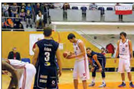
Basketbalový zápas Bohemilk Tuří Svitavy