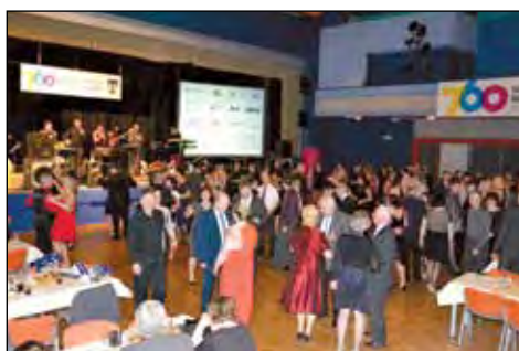
Svitavský ples ve Fabrice