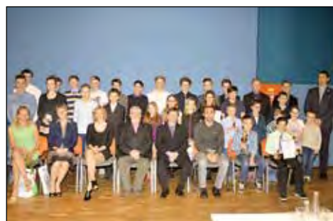
Vyhlášení - Sportovec roku 2015