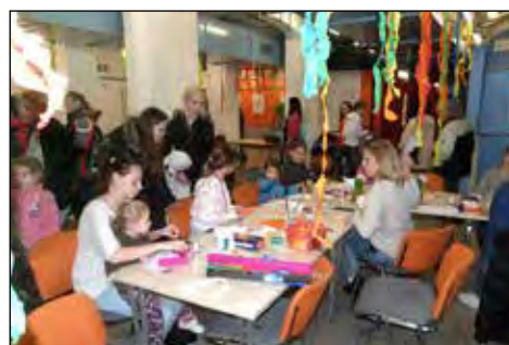
Velikonoce ve Fabrice