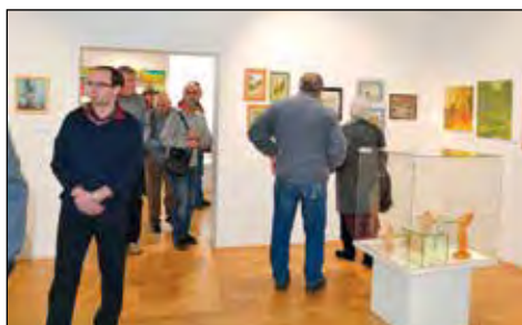
Přehlídka 2016. Vernisáž tradiční výstavy výtvarníků svitavského okresu