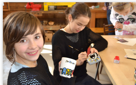
Svitavané sobě - malování hrníčků v muzejních dílnách pro venkovní kavárnu Floriánka.