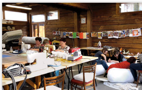
Šití podsedáků pro kavárnu Floriánka.