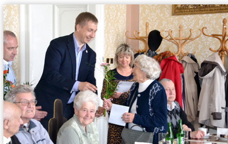
Jubilanti u starosty - setkání seniorů s představiteli města v Langerově vile.