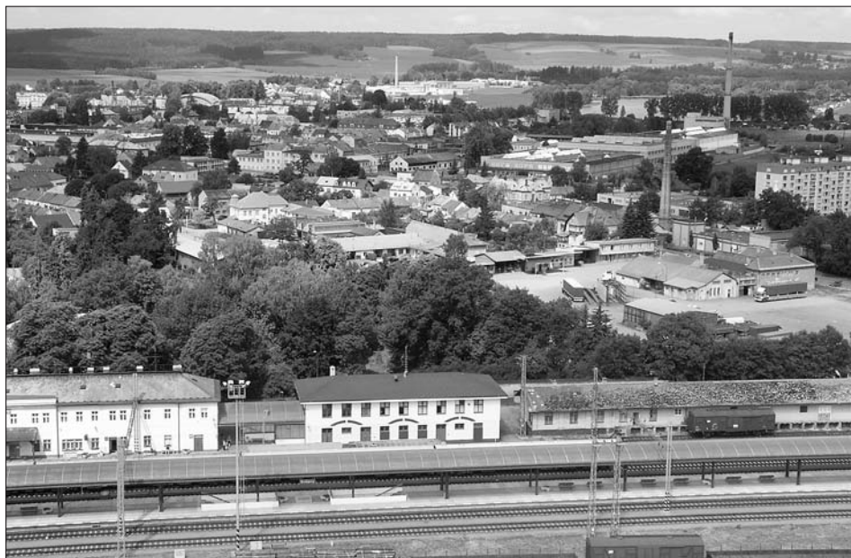
Netradiční pohled na město ze střechy sila.

Dny evropského dědictví (European Heritage Days, dále EHD) každoročně v měsíci září otevírají veřejnosti brány nejzajímavějších památek, budov, objektů a prostor, včetně těch, které jsou jinak zčásti nebo zcela nepřístupné.