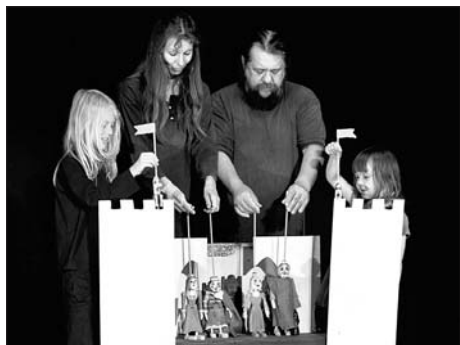
Polehňovi Hradec Králové: Kdo zachrání princeznu?