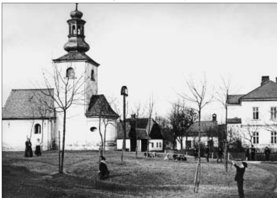
Pozdně barokní kaple P. Marie v Moravském Lačnově