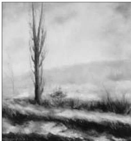
Důvěrně známá, 1993