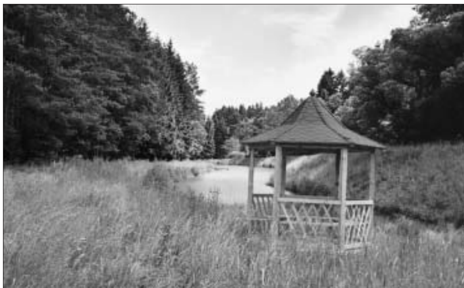
Dřevěný altán u odkalovací nádrže svitavského rybníka z roku 2001

Vrátíme se k pouti, kterou jsme museli v dubnu přerušit. Jarní měsíce přímo vybízejí k tomu, abychom pokračovali tam, kde jsme minule skončili - totiž u Horního rybníka „Rosničky“. Do rybníka přitékají dva přítoky - jeden ústí v bažinaté oblasti v blízkosti chaty Rosničky a druhý přítok protéká pod cestou procházející po obvodu rybníka. Vlevo v olšínách je vytvořen malý rybníček s výskytem obojživelníků. Šířka řeky je 195 cm a její hloubka 28 cm (rok 1999) s uměle vytvořenými kaskádami. Břehy jsou zarostlé rákosem obecným, olšínami a jinými vlhkomilnými rostlinami. Voda dosahuje zvýšeného pH, to se pohybuje kolem 8. stupně (roku 1994). Řeka je přemostěna lesní cestou s nepevným povrchem a dovede nás na okraj nově vybudovaného odkalovacího rybníka s plochou 0,44 ha. Vpravo při hrázi byly v roce 1999 přeneseny rostliny kosatce žlutého z břehů Horního rybníka. Původní říční koryto se ovšem nacházelo v pravé části rybníka na okraji olšin a smrkového lesa. Na okraji rybníka byla vybudována jedna ze zastávek naučné stezky, vedoucí k prameni řeky Svitavy s lavičkou a dřevěný altán na druhém konci rybníka.