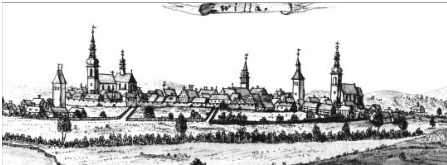
Pohled na Svitavy z roku 1752 od F. B. Wernera. Jsou na něm dobře vidět dvě věže městských bran, ale chybí kostel sv. Floriána z roku 1733.