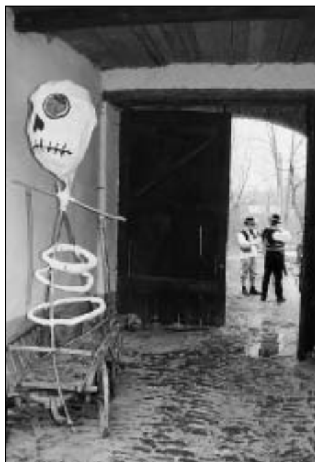
Nálada před masopustem.

Soutěž proběhne v kině Vesmír ve dvou dnech od rána do večera jeden film za druhým v kategoriích: Dokumenty, Reportáže a publicistika, Hrané snímky, Experimentální