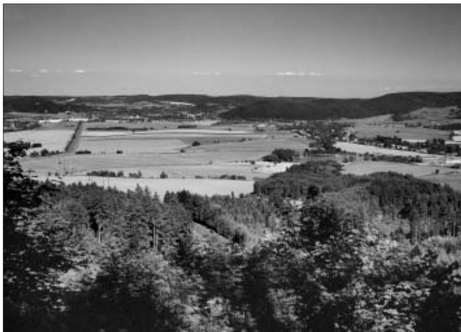
Pohled z Hřebečského hřebene k Moravské Třebové

od táhlého hlavního hřebene vybíhají vedlejší boky, ne tak dlouhé, ale neméně srážné. Díváte-li se na tuto horskou lesnatou hradbu od boršovského hřbitova, zdá se, že jde o jedno pásmo, které se snižuje ke Křenovu, ale tam se znovu zvedá a stáčí. Tam je Hušák a Skalnatý vrch. Nejvyšší z celého Hřebečského hřebene je Roh - 660 m n. m. Do noci z něj svítí červená světla vyslače. Od Křenova dolů k Moravské Třebové se níží silnice jednou z nejdelších horských tkalcovských vsí - Dlouhou Loučkou.