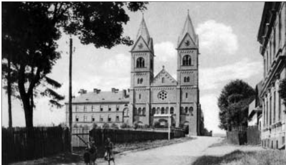
Kostel sv. Josefa krátce po dokončení v roce 1896.