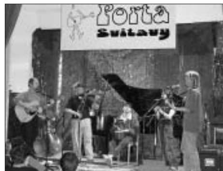
Trstenická stezka na krajském kole Porty v Ottendorferově domě.