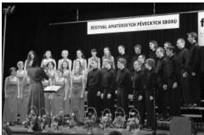
Iventus na 6. ročníku Festivalu amatérských pěveckých sborů v Bílém domě.