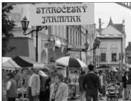
Staročeský jarmark na svitavské Pouti ke sv. Jiljí na náměstí Míru.

Dneska už jsou rok staré. Připomínají čtyři zastavení a vzpomínky na čtyři události v našem městě. Čtyři okamžiky, které pro mě a snad i pro vás - byly v tom roce 2004 výjimečné zvláštní zaznamenání hodné!