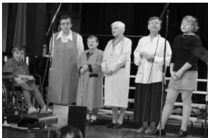
Pěvecký sbor Ladí neladí na benefičním koncertě na záchranu kostela svatého Josefa v Bílém domě.