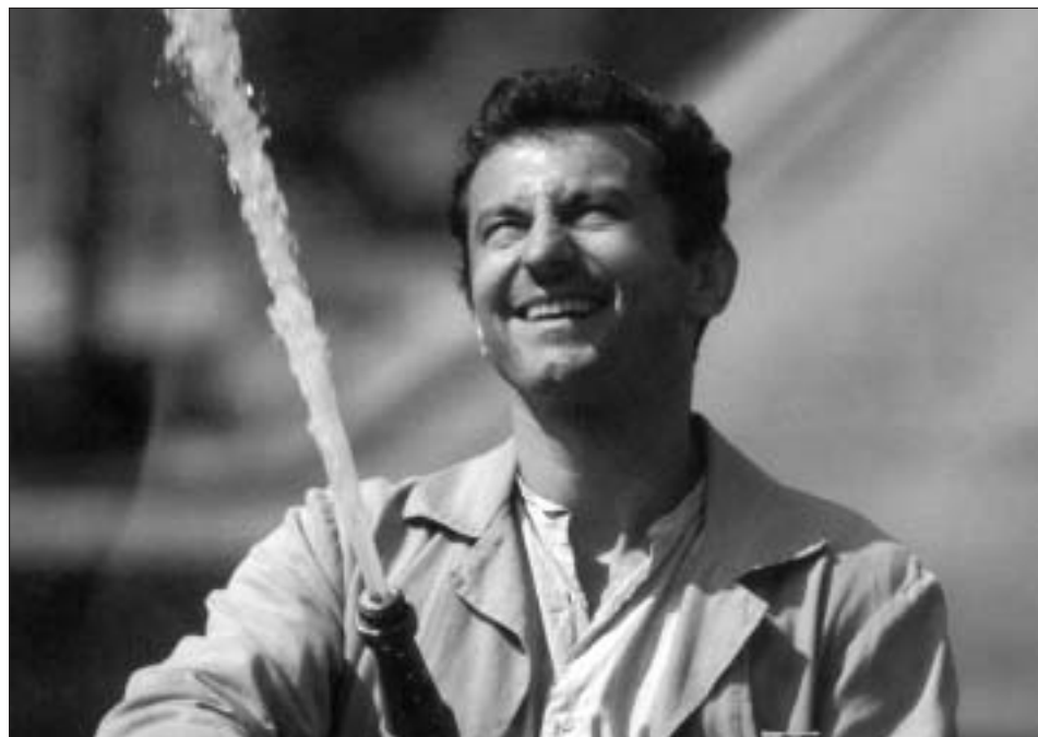
Ondřej Vetchý ve filmu Milenci a vrazi.