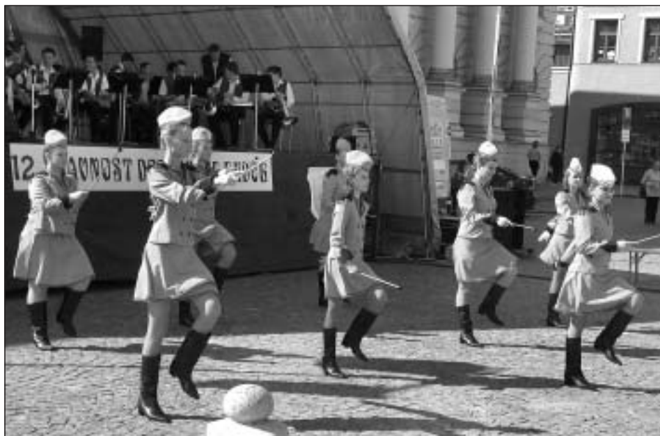
Mažoretky ze ZŠ Lačnov na Slavnosti dechových hudeb v roce 2004