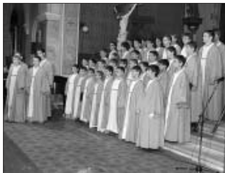
Boni pueri v kostele sv. Josefa

Opravdu s úžasem vzpomínám na Škampovo kvarteto. Tak dokonale krásnou hru smyčců jsem neslyšela dlouho, možná nikdy. Samozřejmě jen musím litovat, že víc lidí neslyšelo tuto úžasnou hudbu, vždyť