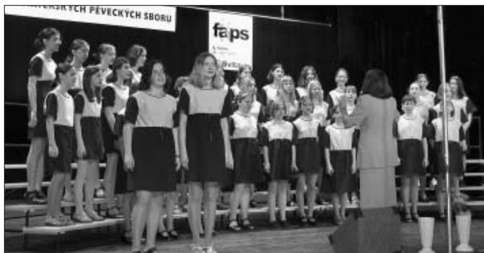
PS Hlásek ze ZŠ Felberova na FAPSu v roce 2004