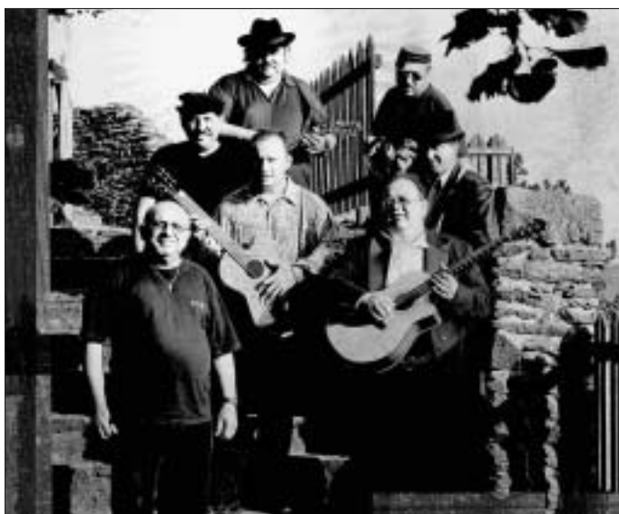
Točkolotoč na Svojanově - plakát

Koncert se uskuteční u příležitosti dvacátých narozenin kapely.