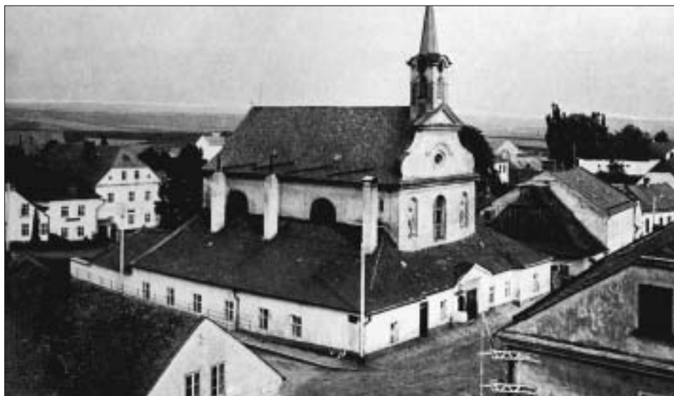
Kostel sv. Floriána s okolními budovami kolem roku 1920.

Od 1. června začíná ve Svitavách turistická sezóna, a tak připomínám, že máte opět po roce možnost podívat se na svitavské náměstí z ptáčích perspektiv věže kostela Navštívení P. Marie. Na poloviční cestě směrem vzhůru, ve světničce zvoníka, je pro vás připravena výstava o historii i současnosti stávajících i již zbořených kostelů a kaplí Svitav a jejich nejbližšího okolí. Věž bude pro veřejnost otevřena od 1. června do 30. září vždy v sobotu od 9 do 11 a v neděli od 15 do 17 hodin . Pokud budete chtít na kostelní vyhlídku vystoupat mimo tyto dny, musíte si pro klíče a průvodce zajít buď do Informačního centra na svitavském náměstí, a nebo do Městského muzea a galerie. Pracovníci obou institucí vám věž ochotně otevřou. Vstupné je 10 korun. -bě-