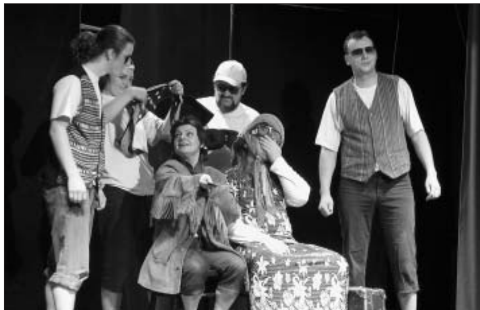
Svitavský ochotnický spolek ZAKLEP: Cesta kolem světa