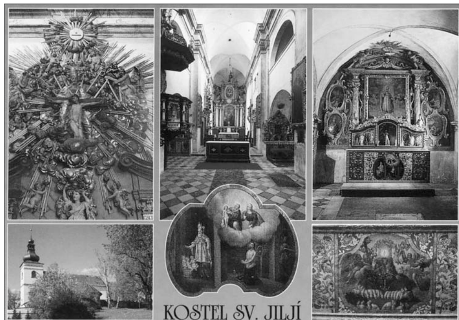
KOSTEL SV. JILJÍ

Kostel sv. Jiljí na pohlednici od Zdeňka Holomého.