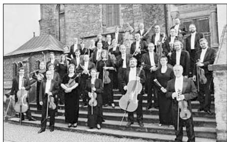
Komorní filharmonie Pardubice