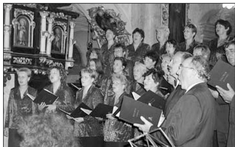
PS Dalibor na Slavnostním koncertě u příležitosti Pouti ke sv. Jiljí 1. 9. 2002