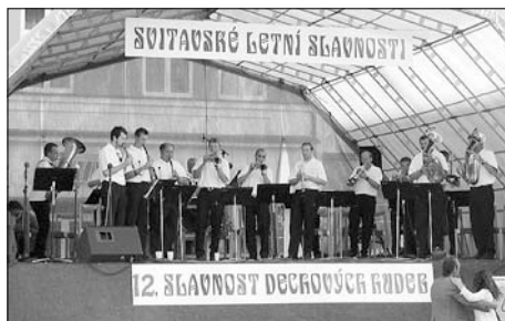
Svitavská dvanáctka na loňských slavnostech