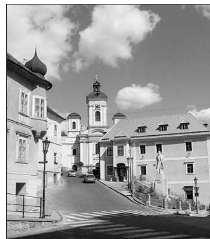
Jedna z působivých uliček Banské Štiavnice.