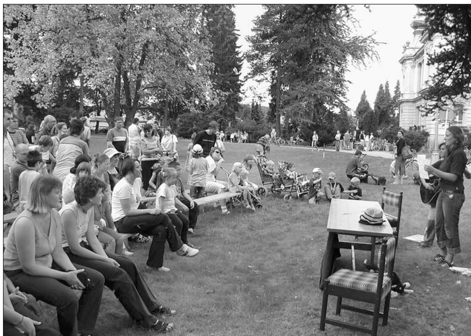
Hlasy v parku I. 15. srpna 2004