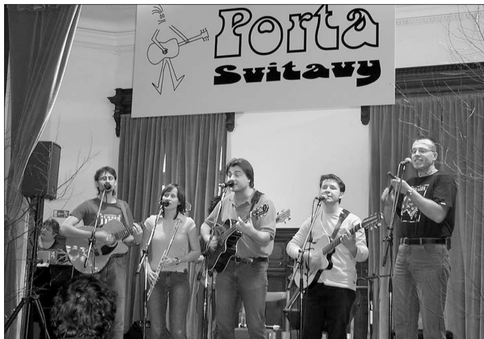
Vítězná kapela Marien na Krajském kole Porty v Ottendorferově domě ve Svitavách.