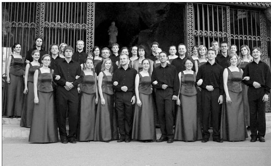
Pěvecký sbor Iuventus Svitavy koncertoval v Budapešti.