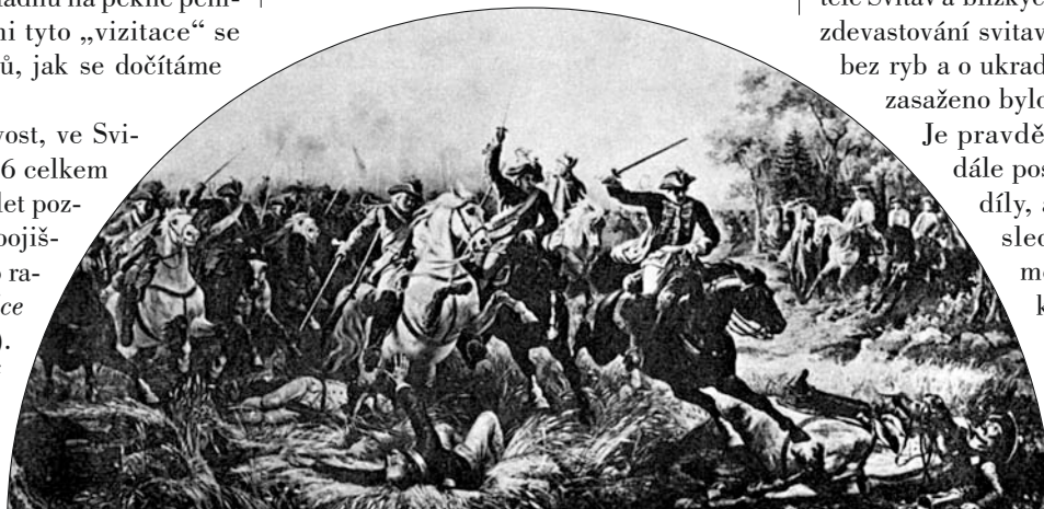
Výjev z bitvy u Kolína v roce 1757 mezi vojskem pruského krále a rakouskou armádou.