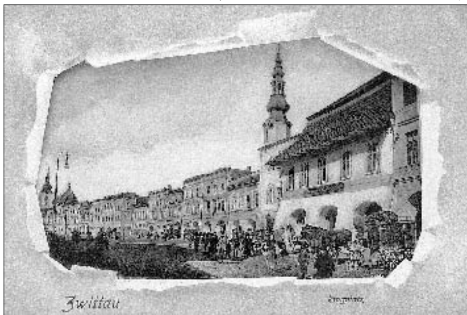
Svitavský dům U Mouřenína, místo vzácné návštěvy roku 1776.