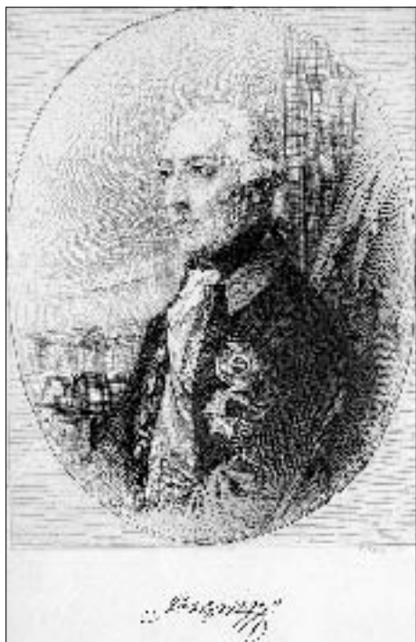
Císař Josef II.