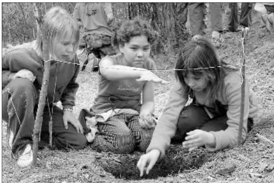
„Až sem musejí být plameny.“ (Přepalování provázku na čas.)

Chcete-li se nechat vtáhnout do atmosféry letních táborů a výprav do přírody, budete srdečně zváni na výstavu, jakož i na další doprovodné akce: V neděli, dne 9. října od 16:00 proběhne slavnostní vernisáž, ve čtvrtek 20. října od 18:00 promítání diapositivů z putovní expedice po rumunských pohořích Maramureš a Rodna, v pátek 21. října od 17:00 promítání fotografií z letošních táborů. Zveme obzvláště bývalé