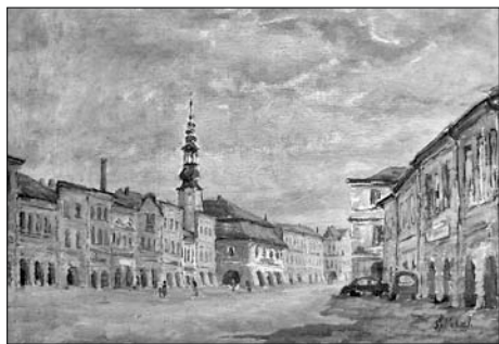
J. Šplíchal: Svitavské náměstí, 50. léta 20. stol.

Na přírůstek z jara, jenž si k nám našel cestu od svitavské Vigony přes Krnov a rodninu Wojtkovu z Neplachovic, je spojitost s městem na první pohled zřejmá. Typická silueta staré radnice nad podloubím le-