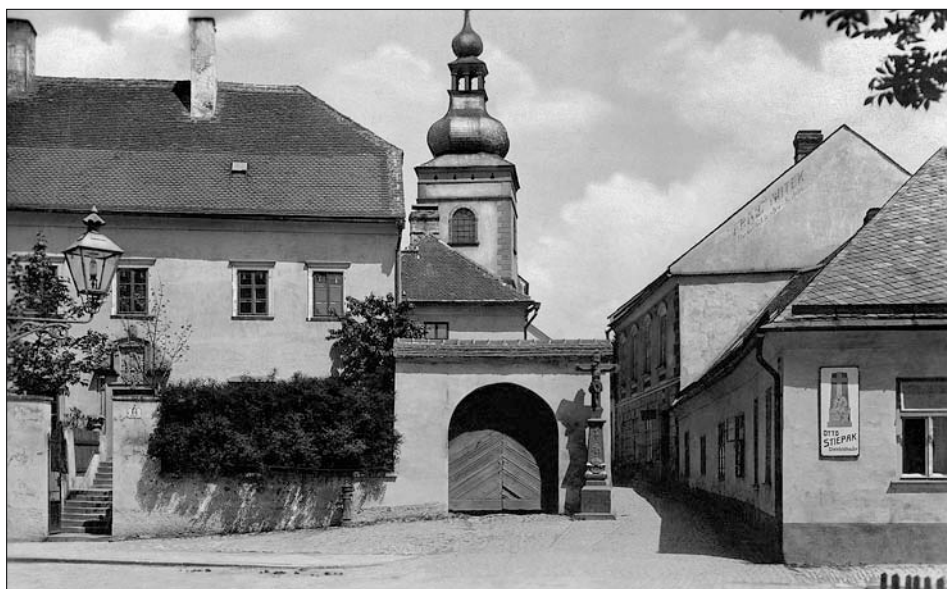
Nejstarší svitavská škola byla ve farní budově u kostela sv. Jiljí.