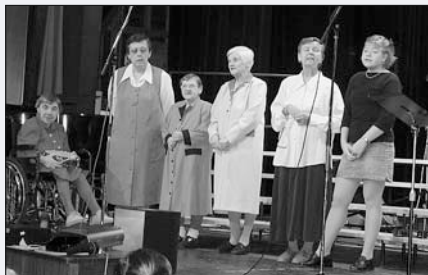
Ladí - neladí ÚSP Svitavy na Benefici pro kostel sv. Josefa 2004

2001: Benefice pro mentálně postižené 2002: Benefice pro Kojenecký ústav 2003: Benefice pro Speciální školu 2004: Benefice pro kostel svatého Josefa