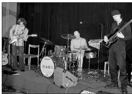
Facing West Trio v kinokavárně v únoru 2005.

Téma dílny: Hudba jako východisko aneb cesta od hudby k divadlu.