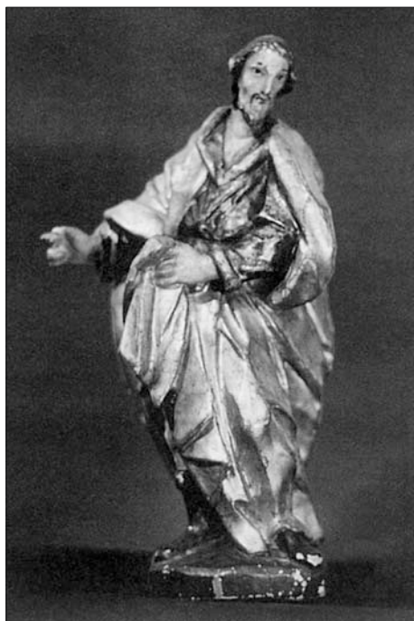
Sv. Josef, figurka svitavského farního vánočního betléma.