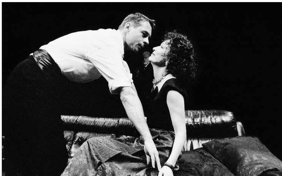
Kdo se bojí Virginie Woolfové?