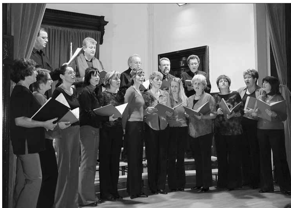
PS Červánek na Vánocích v Ottendorferově domě v roce 2005.