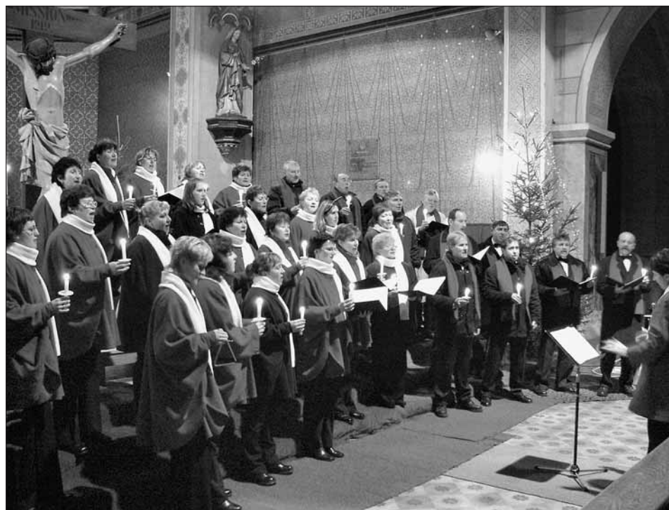
PS Dalibor na vánočním vystoupení v roce 2005.

24. prosince 2006 - 1. ledna 2007: 13 - 17 hodin