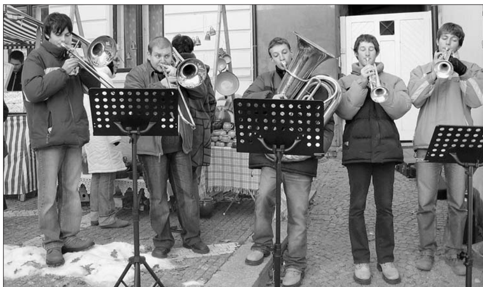
Vánoce ve Svitavách v roce 2005.

Dvořák, mimochodem učitel všech hráčů kvintetu, včetně nynějšího vedoucího MgA. Lukáše Moravce. V roce 2005 se podařilo navázat na dobré vztahy s profesory