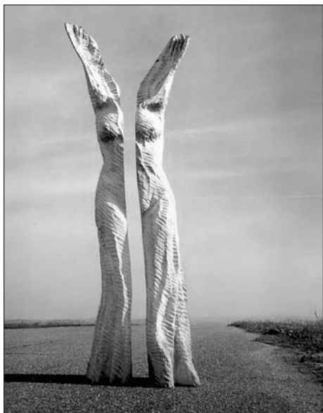
Z. Macháček: Transformace ženy