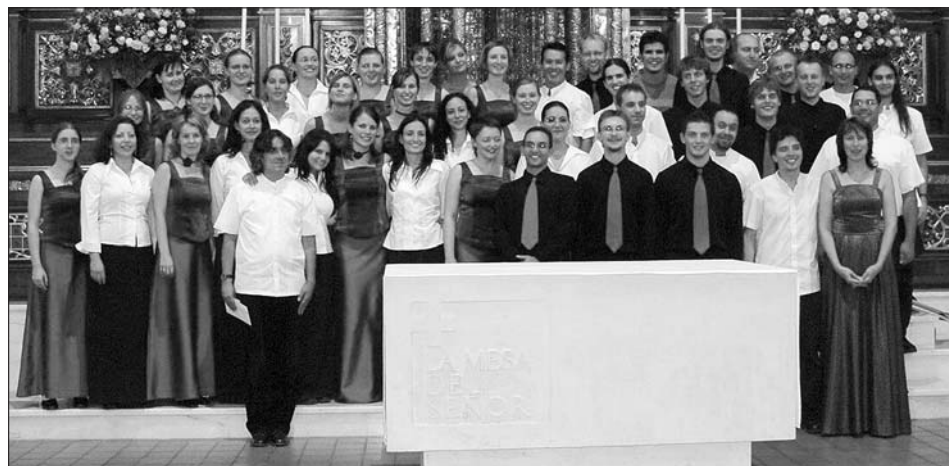
Vocal Ansamble de Medellin a Pěvecký sbor IUVENTUS Svitavy na koncertě v Medellinu v srpnu 2006.

v sobotu 15. září 2007 od 19:30 hodin v kostele Navštívení Panny Marie ve Svitavách, na programu se objeví skladby duchovní i světské, bezesporu nebude chybět ani tradiční kolumbijská lidová tvorba. Jihoamerické umění uslyší rovněž milovníci sborového zpěvu v Praze, Olomouci, Brandýse nad Labem, Litomyšli a Poličce, kde se Vocal Ansamble de Medellin během svého pobytu v České republice také představí.