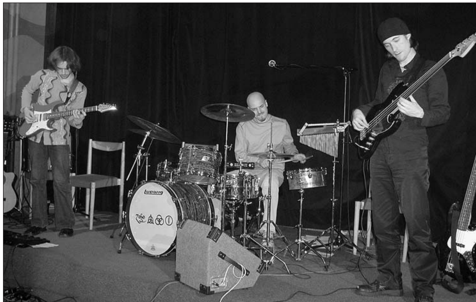
FACING WEST TRIO v Kinokavárně ve Svitavách 4. 2. 2005.