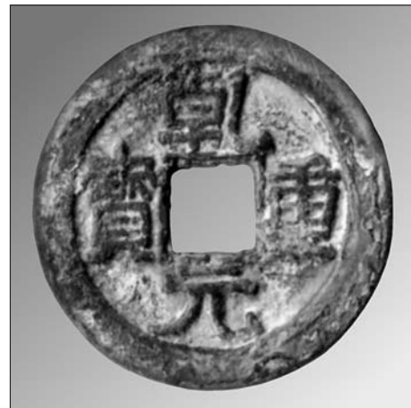
Kaiyuan z roku 621 po Kr.

Použito Tiskové zprávy Národní knihovny ČR