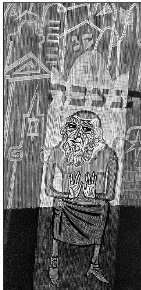
Isaak Babel: Oděské povídky - ilustrace, dřevoryt, papír

Ve Svitavách se můžete těšit nejen na jeho zajímavé kaligrafie, ale také např. na ilustrace Oděských povídek od Isaaka Babela, cyklus poznamenaný hlaholským písmem, či jeho labily. Že nevíte, co to je? Přijďte se podívat na výstavu, nebo navštivte besedu s autorem, kterou plánujeme na čtvrtek 13. září.