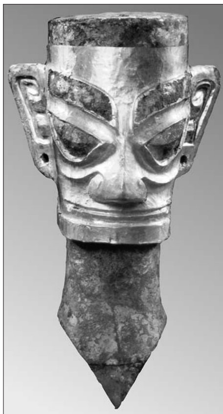
Bronzová soška se zlatou maskou z dynastie Šang z 1600 př.

Expozice připomíná nejrůznější druhy čínských platidel od mořských mušlí, přes bronzové, stříbrné, zlaté či měděné mince až k moderním papírovým bankovkám, mezi nimiž neschází ani hongkongské dolary či makajské pataky. Ke kuriózním exponátům patří mince jen-seng, které se v Číně vyráběly před více než dvěma tisíci lety za účelem