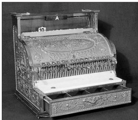
Registrační pokladna z Daytony v Ohiu.