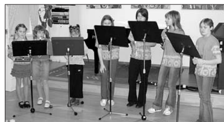
Vystoupení flétnového souboru ZUŠ.

http://petrzela.wz.cz/ples/rozvrzeni.html