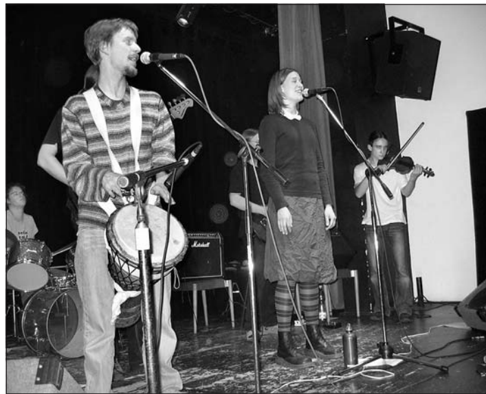
Koncert alternativní rockové skupiny.