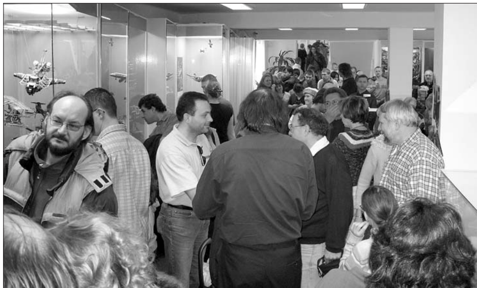
Na vernisáž výstavy „Lego - hobby i hračka“, která se stala nejnavštěvenější v historii muzea, zavítali sběratelé z celé České republiky. Stránku připravila Blanka Čuhelová

Byl to snad dobrý rok. A ten letošní? Čeká nás práce na nové expozici, budování nových depozitářů a máme samozřejmě připraveny i zajímavé výstavy a další akce. Snad si k nám zase najdete cestu.