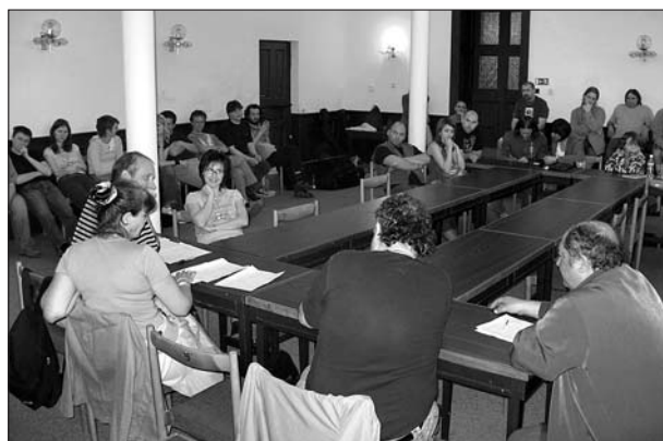
Pohovor soutěžících s porotou