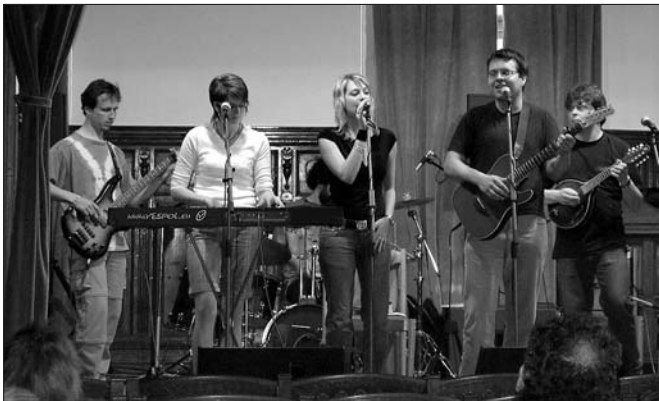
Vespol Dolní Újezd