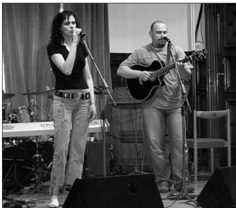
MirHa Hradec Králové