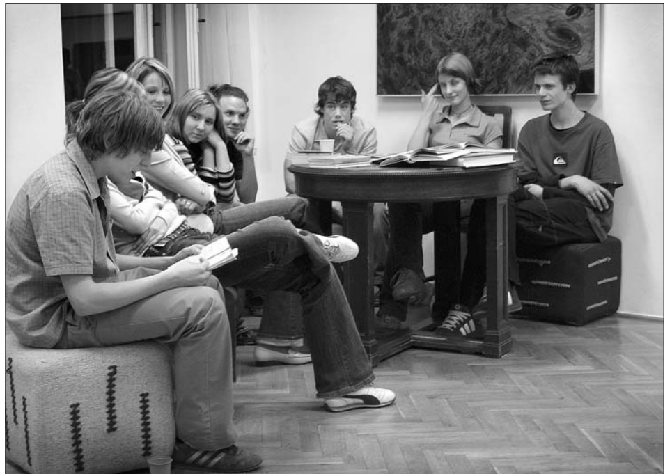
Non stop čtení v muzeu v roce 2005.