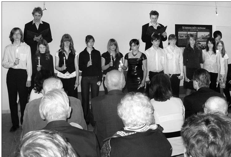
Improvizované pódium a členové Docela MALého divadla při SKS zažijí svíce za svitavské oběti holocaustu.