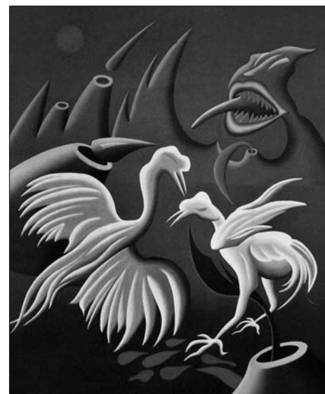
Jiří Kříklava: Zápas