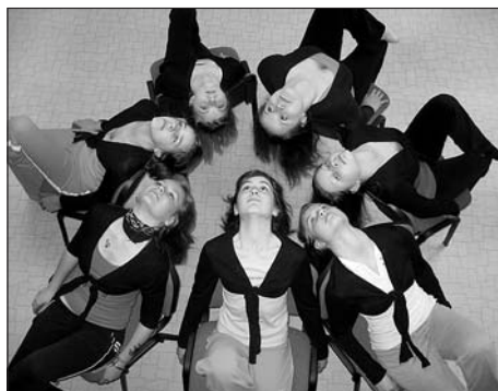
ZUŠ Svitavy zve na XVI. Večer tance.

18. St 17:30 hod. koncertní sál ZUŠ Žákovský hudební večer