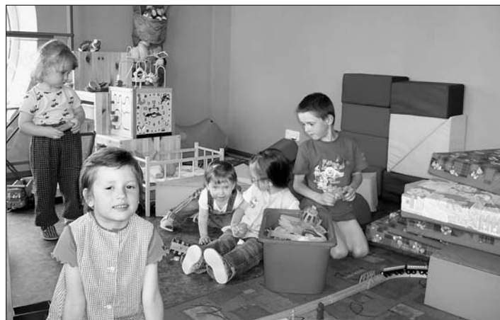
Mateřské centrum Krůček v nových prostorách ve Fabrice

Přijďte se nezávazně podívat, první návštěva zdarma!