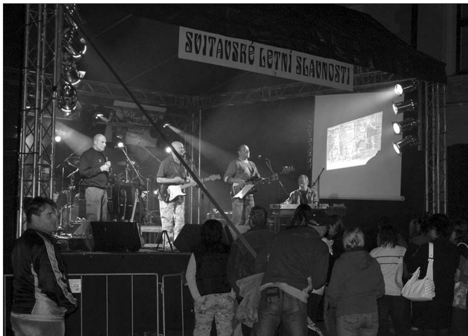
Loňské Svitavské slavnosti - hudební skupina Buty