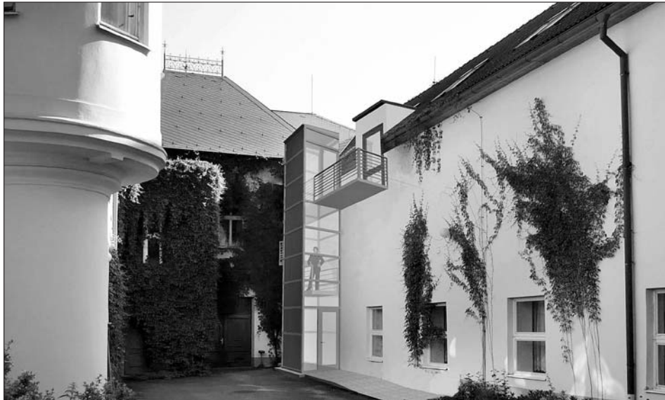
Počítačová studie k projektu výtahu muzea

V příštích letech nás čekají úpravy muzejní zahrady, které umožní výstavy, koncerty či jen příjemné posezení po prohlídce muzea pod širým nebem. B. Čuhelová