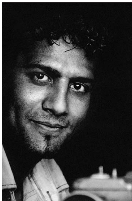
Pavel Snoha: Pohledy z Egypta.