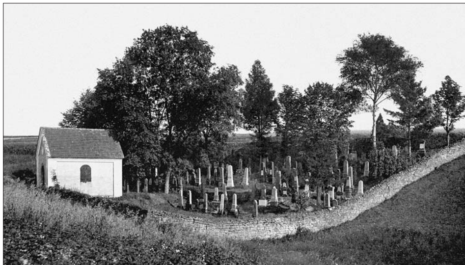
Ve fotoarchivu Regionálního muzea v Litomyšli se dochovala i tato fotografie hřbitova z roku 1926.