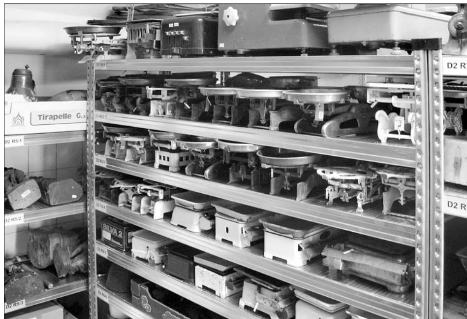
Pohled do nově zařízeného depozitáře se sbírkou řemesel, obchodu a domácnosti.

souběh obojího. Pravdou je, že si do Svitav našla letos cestu řada turistů ze všech koutů naší země, i ze zahraničí. A tak listuji knihou návštěv a čtu: výstavy úžasné, originální, ohromný nápad, je to tu skvělé, děkujeme za krásně prožité odpoledne ..... Žamberk, Nymburk, Ústí nad