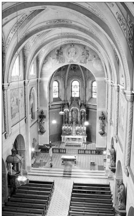
Interiér kostela sv. Josefa.

letech poprvé z plenéru přesunula do galerie. Zpřístupněna bude také budova Ottendorferova domu, kde právě v těchto dnech probíhá další fáze restaurování oken v koncertním sále a také Muzeum esperanta s výstavou ilustrací Pavla Raka. -bě-