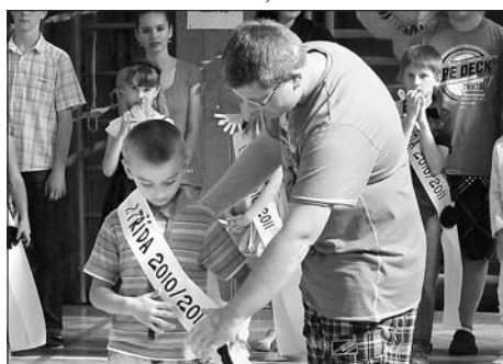
Vítání budoucích prvňáčků v ZŠ Riegrova