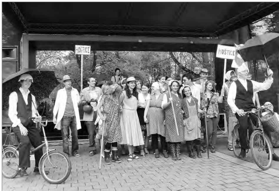
Při letošním Majálesu se na 1. místě umístili studenti 2.B Gymnázia Svitavy jako dvojice farářů na kole z filmu „Slunce, seno, jahody“.