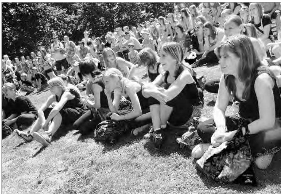
Dětský den 2011.