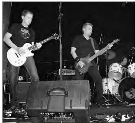
Skupina Syfon

Na pomezí Moravy a Čech na parkovišti u restaurace „U TETY“ na Hřebči se bude 23. června od 10 hodin konat festival Hřebečský slunovrat. První ročník muzikantského setkání dvou sousedních měst Svitav a Moravské Třebové – by se rád stal tradicí. Přátelské soupeření kapel z obou měst doplní na vedlejším pódiu tanečnice a tanečníci a vše vyvrcholí koncertem kapely pro toto místo přímo symbolické vystoupením Čechomor. Od půlnoci se můžete pokochat Laserovou show a na diskotéce se protancovat k ránu. Občerstvení, nápoje, cukrovinky apod. budou zajištěny nejen v restauraci, ale také ve stáncích, které budou lemovat parkoviště. Nezapomeňte doma děti. Určitě by jim, kromě jiného, bylo líto, že si nemohly zaskákat na nafukovacích hradech.