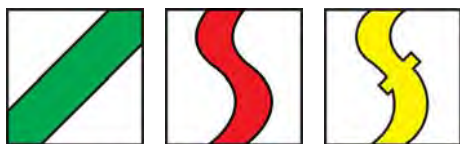
Označení jednotlivých okruhů – zleva: naučná stezka, cyklostezka a fitness stezka.

Projekt vychází vstříc společenskému trendu zvyšování významu zdravého životního stylu. Cílem je poskytnout návštěvníkům široké spektrum sportovních, rekondičních a naučných aktivit ve zdravém přírodním prostředí a odlákat dospělé a především děti od televize a počítačů. Oblast Brandu za rybníkem Rosnička je pro tyto funkce svojí polohou a charakterem ideální. Rekreační funkci plní rybník a jeho nejbližší okolí již od roku 1929, nyní bude oblast rozšířena na celý lesní komplex Brand mezi Svitavami, Javorníkem, Kuklemi, Mikulčí a Opatovcem. Ze všech stran bude areál označen informačními tabulemi s přehlednou mapou. Všechny stezky budou přehledně vyznačeny pásovým značením s motivem meandru řeky Svitavy, jehož vlnovka bude tvořit místní značení jako alternativu rovné značky turistických tras KČT. První etapa projektu má čtyři základní části: