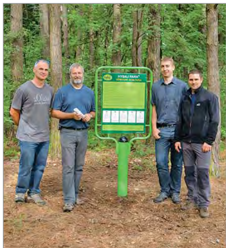
K předání venkovní posilovny a fitness stezky došlo 18. června.

Prodloužení naučné stezky financují Lesy ČR. Následující částí projektu bude financovat město nákladem 717 tis. Kč, z toho Pardubický kraj přispěje grantem 185 tis. Kč a 183 tis. Kč bude použito z dotace MPSV pro vítěze v soutěži Obec přátelská rodině, kterou město v loňském roce vyhrálo.