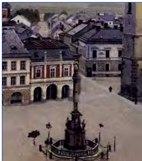
Dům rodiny Freundovy na náměstí (dnes ČSOB) na prvorepublikové pohlednici.

Kapela hraje klezmer - tedy tradiční instrumentální hudbu východoevropských Židů, která největší rozkvět prožívala ve druhé polovině 19. století. V repertoáru se nachází i několik zpívaných kousků (jidiš, čeština, ruština). Kapela absolvovala stovky koncertů po celé České republice i Evropě (Švédsko, Polsko, Slovensko) a v březnu 2010 koncertoval také v USA (New York, Washington DC).