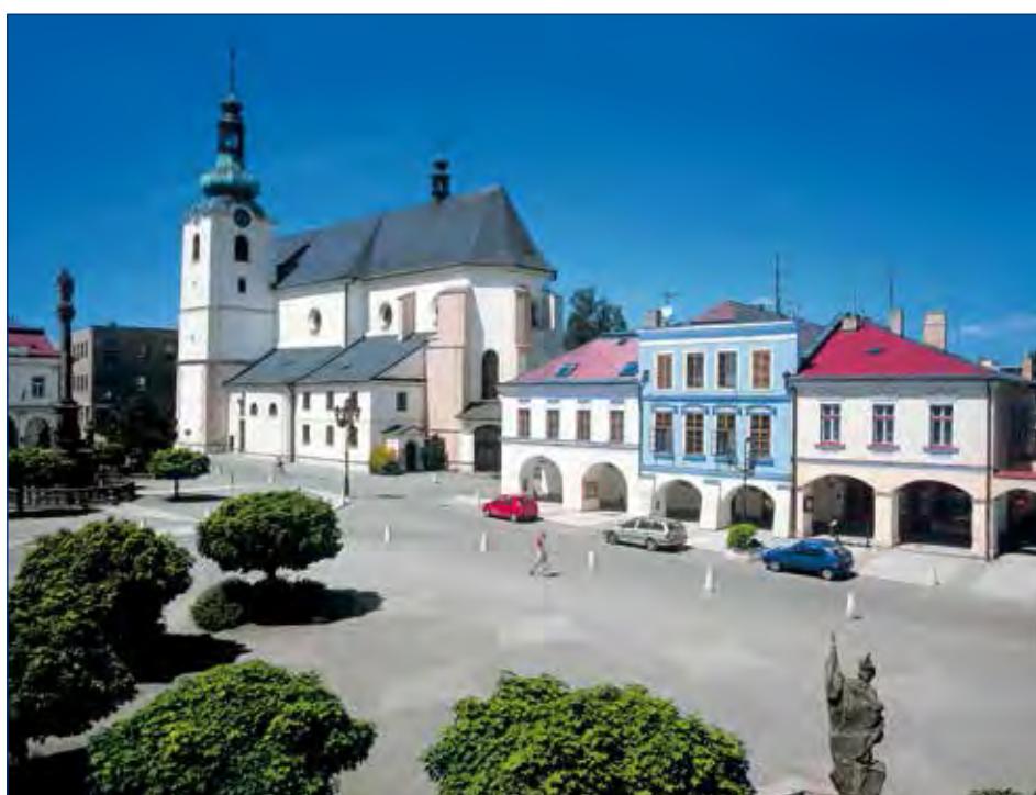
Brány památek dokořán proběhnou 20. – 21. dubna ve Svitavách, Javorníku, Hradci nad Svitavou a Vendolí.