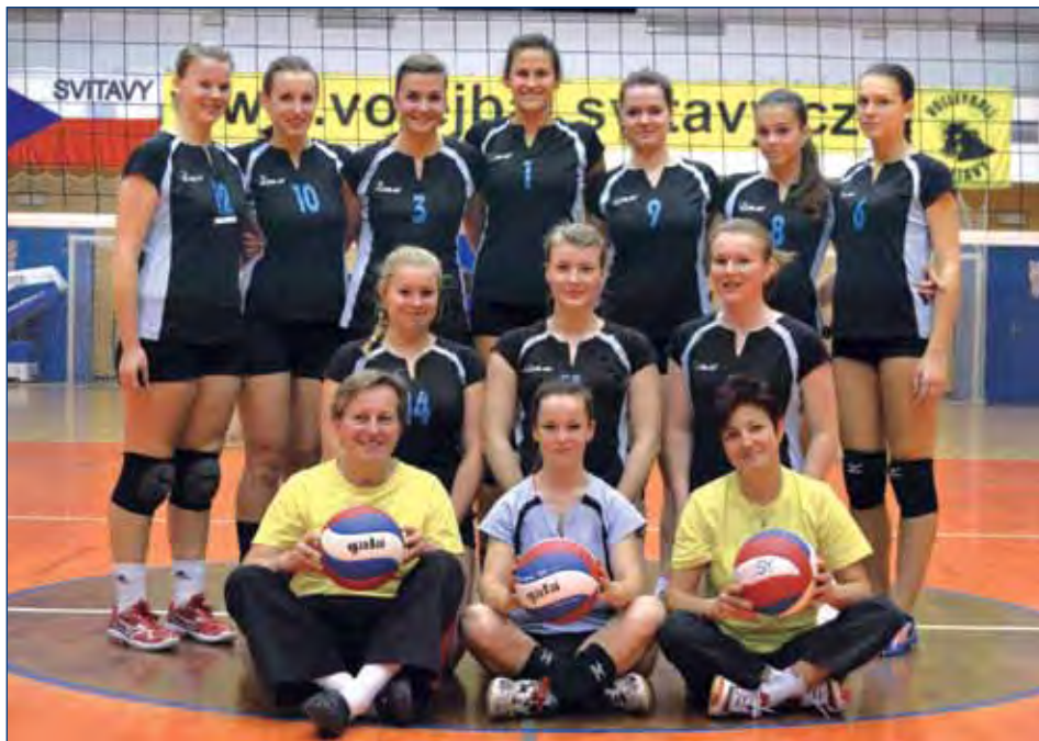
Svitavské juniorky - postup do 1. osmičky Českého poháru

První prosincový víkend byla sportovní hala plná šikovných volejbalistek, svitavský oddíl totiž pořádal 2. kolo Českého poháru juniorek, nejvyšší nemistrovské soutěže této kategorie. Soutěž se hraje turnajově, účastní se 24 družstev z celé ČR, rozdělených do tří osmičlenných skupin. V zářijové kvalifikaci byly domácí volejbalistky podle výsledků zařazeny do 2. osmičky, v 1. kole v říjnu pak tuto skupinu obhájily.