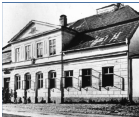
Původní svitavská pošta