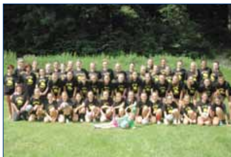
Žákyně a dorostenky na letním soustředění v Hostálkově

Volejbalový oddíl má nyní 408 členů , z toho tvoří žactvo a dorost tři čtvrtiny. Do soutěží 2014/15 máme přihlášeno 33 družstev a další „mini týmy“ se budou účastnit turnajů Barevného minivolejbalu.