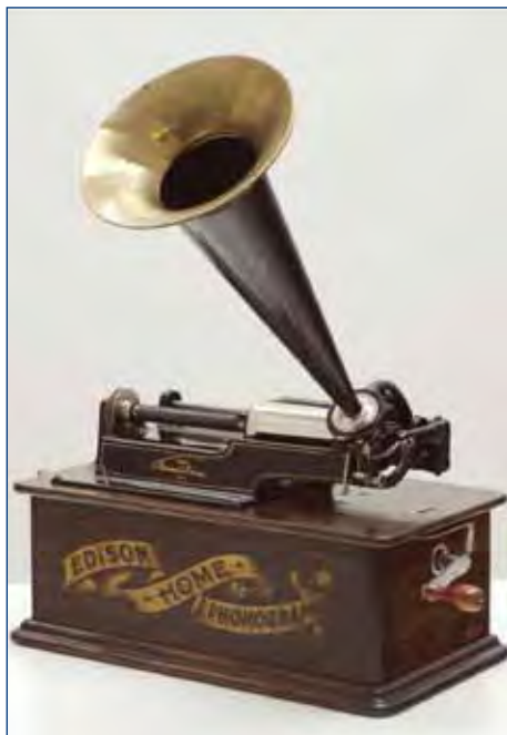
Fonograf Edison Home model „C“, Edison Company, USA, 1908–1910

Výstava Hudba ve spirále v muzeu si klade za cíl představit návštěvníkovi vývoj gramofonového průmyslu v Čechách a na Moravě v letech 1890 až 2014 prostřednictvím sbírek Muzea elektrotechniky a médií Národního technického muzea v Praze. Hlavní akcent výstavy je kladen na individuální reprodukční stro-