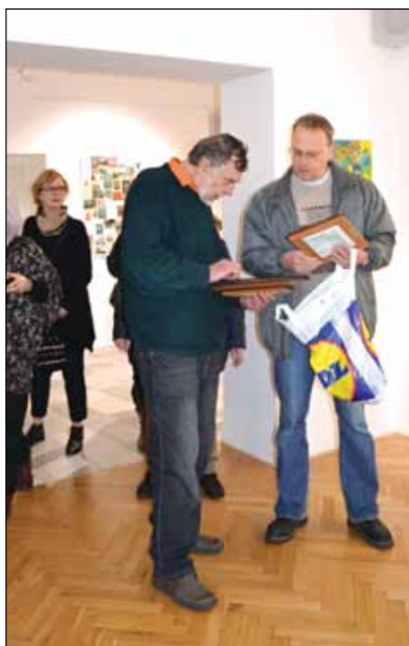
Z diskuze na Poradenském dnu pro výtvarníky, který vždy předchází výstavě.