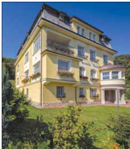
Vila v Chrástavci - Půlpecnu