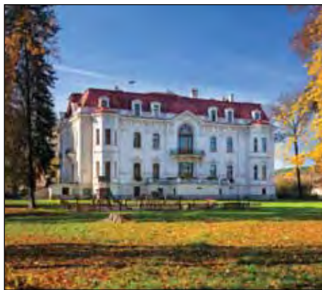
Velká vila ve Svitávce

Výsledkem projektu s názvem Löw-Beerovy vily, jehož realizátory byly místní akční skupiny Boskovicko PLUS a Svitava, vznikla putovní výstava, film a publikace o těchto architektonických skvostech. Židovská rodina Löw-Beerů pocházela z Boskovic, ale její kořeny jsou stěžejí dohledatelné, neboť roku 1788 musela přijmout německé jméno. Od průmyslové revoluce patřila k nejvýznamnějším podnikatelským rodinám v mnoha oborech průmyslu, zvláště pak v textilnictví. Své továrny pak měla na mnoha místech Moravy a vedle nich vznikaly rezidenční vily, dodnes perly secesního stavitelství. Víte, co mají společného vily ve Svitávce třeba s Mahenovým divadlem či brněnským vlakovým nádražím? A co s brněnskou vilou Tugendhat? Na tyto a další otázky