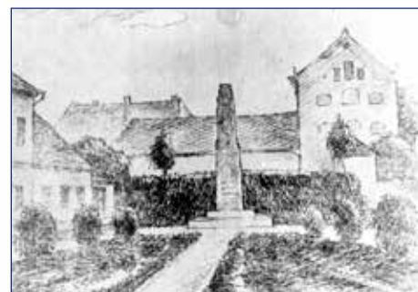
Takto měl vypadat Pomník osvobození na náměstí Národních mučedníků (dnes Malé náměstí)