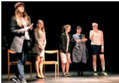
Svitavský dýchánek - krajská postupová přehlídka dětského a loutkového divadla Pardubického kraje.