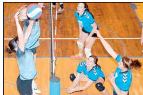
Svitavské volejbalistky si na kvalifikačním turnaji zajistily setrvání ve druholigové soutěži.