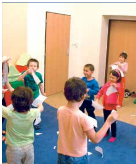
Speciální základní škola a střední škola. Návčik správného dýchání.