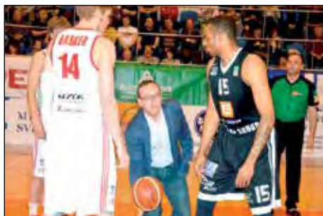
Bohemilk Tuří Svitavy s týmem Nymburku v play-off nejvyšší basketbalové ligy.