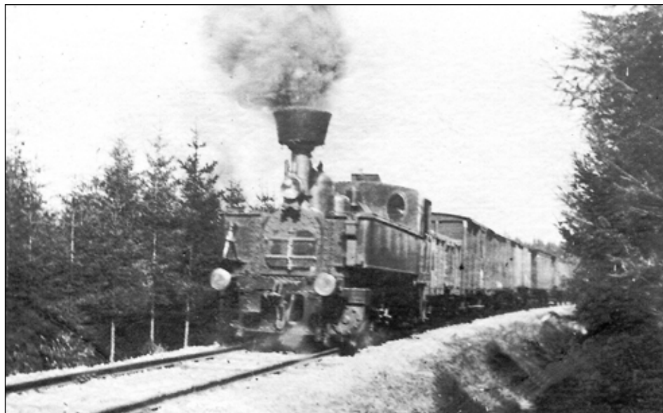
Smišený vlak v lokalitě Kuhling mezi Svitavami a Květnou v roce 1910.

(S využitím textu z připravované publikace ke 120. výročí trati Svitavy-Polička.)