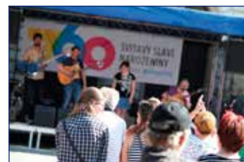
Slavnostní přítěk káfičkem během slavnostního otevření venkovní paletové kavárny Floriánka. Tým MIC. Jedlo se, pilo, hodovalo a poslouchala muzika.