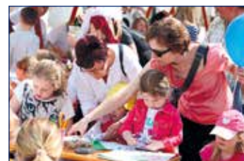
Mezi bohatý program patřil slavnostní průjezd historických kol, soubor šachového mistra proti několika hráčům a zábavné tvoření pro děti.