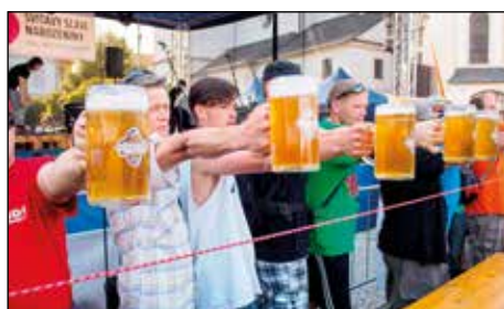
Pivní slavnosti - dovednostní soutěže :)