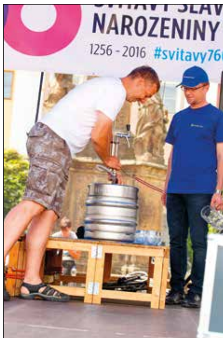
Zahájení pivních slavností naražením sudu