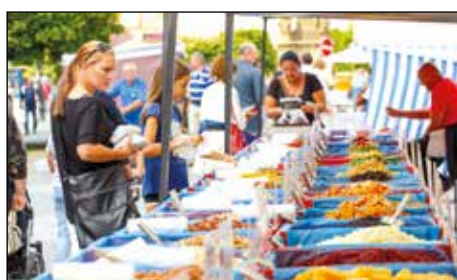
Farmářské trhy na náměstí