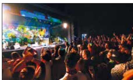
Hudební festival Rosnička