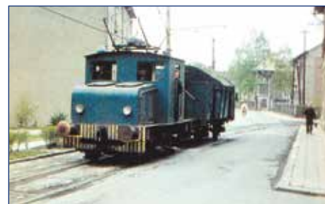
Elektrická lokomotiva 16E2 s uhlím pro kotelnu závodu I. na Kijejské ulici.

A tak se vypravíme na závěrečnou procházku po historii místní dráhy. Řeč bude o černých dnech, ale také o zajímavostech. Hned první incident na skutečné části trati se odehrál 6. října 1897, kdy byl vlakem usmrčen kůň. Po této události to vypadalo na trati celkem klidně, až přišel tragický 24. červen 1995, který se zapsal do historie jako datum jednoho z největších neštěstí na české železnici. Hrubou nedbalostí při posunu ve stanici Čachnov ujely tři vozy na trať a u Krouny se srazily s protijedoucím osobním vlakem. Následky srážky byly katastrofální. Zahynulo 19 osob, včetně strojvedoucího a vlakvedoucího. Tragédie pochopitelně ovlivnila i plánované velké oslavy stého výročí dráhy. Na místě srážky dnes stojí pomník. Ale k drobným nehodám docházelo po dobu celého provozu trati, a to zvláště na silničních přejezdech.