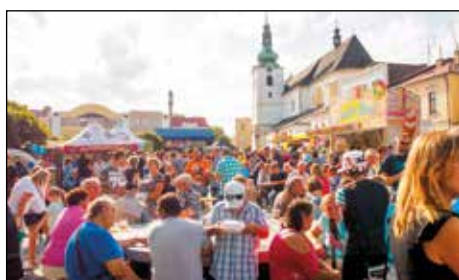
Pivní slavnosti v plném proudu :)