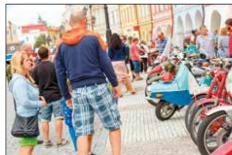
Výstava historických vozidel