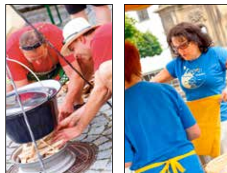
Kuchařské týmy v soutěži o nejlepší kotlíkový guláš