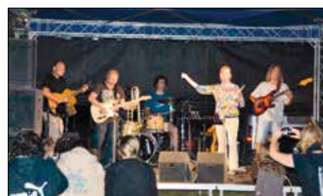
Písničkáři v parku Jana Palacha