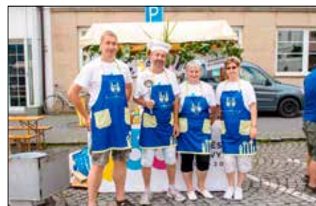
Městský tým v soutěži o nejlepší kotlíkový guláš