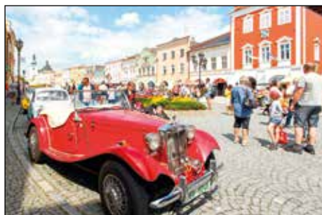
Výstava historických vozidel