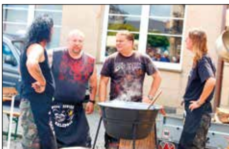
Tým v soutěži o nejlepší kotlíkový guláš