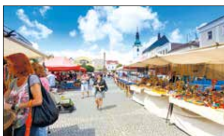
Farmářské trhy na náměstí