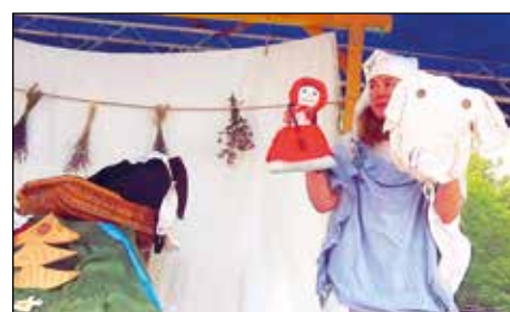
Nedělní pohádka v parku