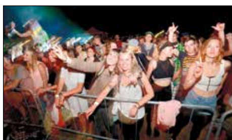
Hudební festival Rosnička