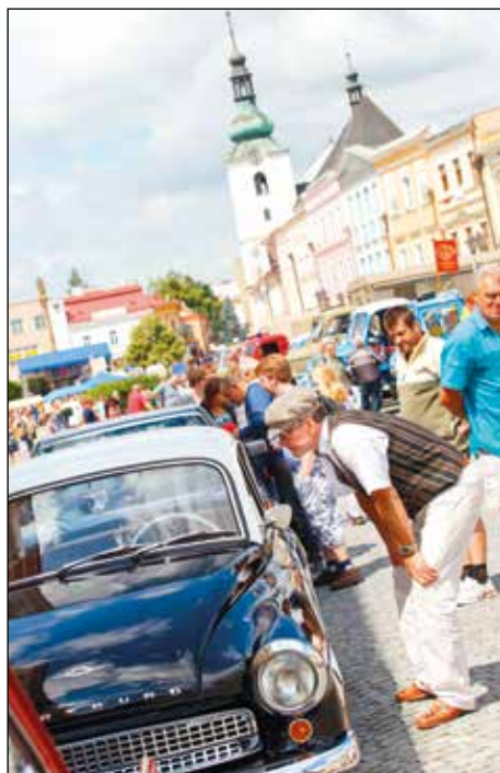
Výstava historických vozidel