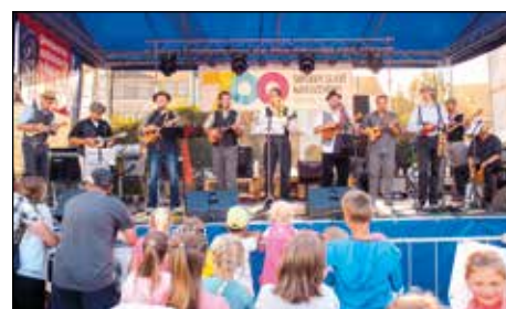
Premiérové vystoupení svitavské kapely SUE