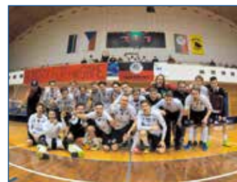
Florbalisté míří do play-off.