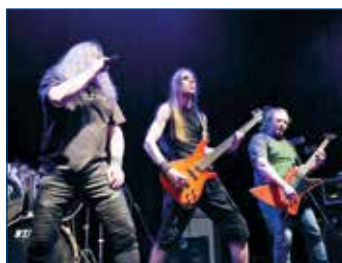
Metal v Tyjátru.