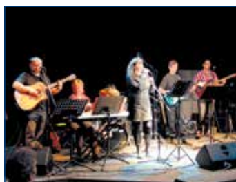
Minifest aneb nonstop divadelní a hudební večer s divadlem DOMA.