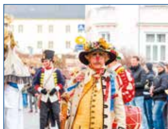
Masopust a zabijačkové hody.