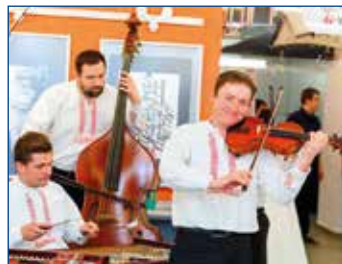
Reprezentační ples města si Svitavané náramně užili.