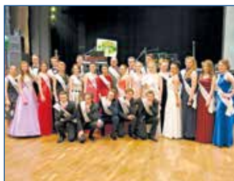
Ples oktávy A svitavského gymnázia - maturanti a tanec s rodiči.