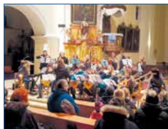
Setkání Zapalme svíčku.