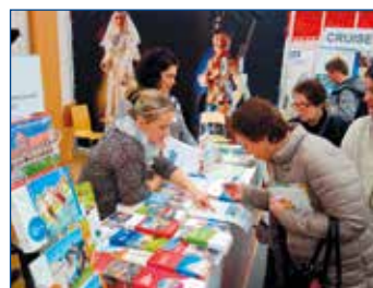
Svitavy na Holiday World v Praze.