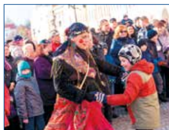
Hrálo se, tancovalo a hodovalo. Podařená sobota ve Svitavách!