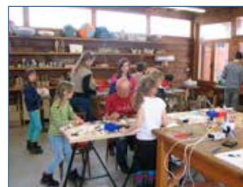
Sklářský workshop v muzeu.