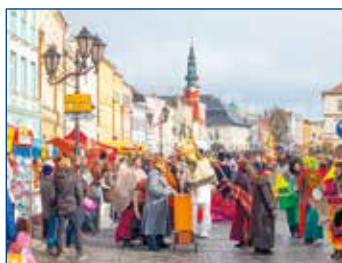
Počásí jako na objednávku a zábava v plném proudu :)