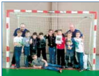
Mladým fotbalistům se dařilo. Obě mužstva skončila na 2. místě turnaje.