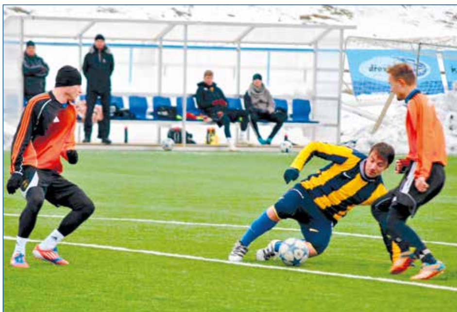
Zimní příprava svitavských fotbalistů je v plném proudu, snímek je z utkání TJ Svitavy A - Opatovec.