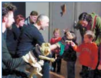
Představení pro děti v Divadle Trám - Žabáci (Divadlo Líšeň).

ky, plesy, karnevaly...), která je svým významem zajímavá pro občany našeho města? Pochlubte se jistě báječnými výsledky a zašlete nám fotografii s krátkým popisem na e-mail: spolecne@svitavy.cz . Děkujeme. Budeme se těšit na naše svitavské rodinné album :) Petr Šmerda