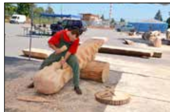
Řezbáři tvořili svá díla od pondělí do soboty a takhle vše probíhalo.