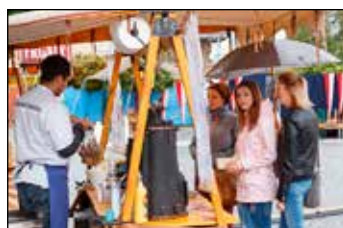
Dobrá čokoláda se hodila.