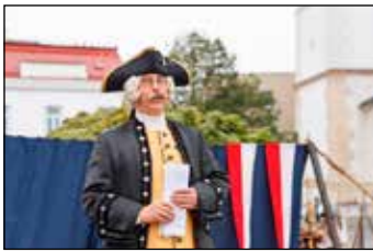
Hrálo se, zpívalo i tancovalo. Představila se hudební skupina Codex.