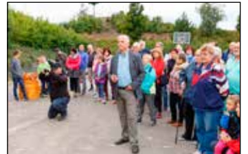
Lavičky jsou prostě fajn a líbí se!