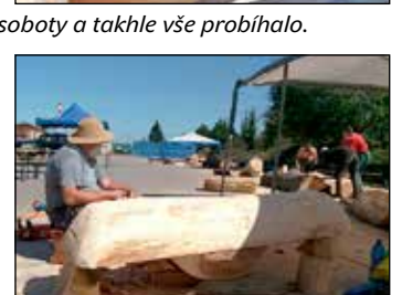
Bude to vana nebo stůl...?