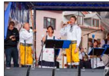
Pivoňka ZUŠ Svitavy, Bludověnka z Bludova, Jarda Gang Svitavy, Pohoranka Sebranice, Svitavská dvanáctka, DH Střelín, Astra Svitavy, Záhorienka Stupava.