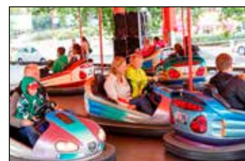
Auta pořád frčí.