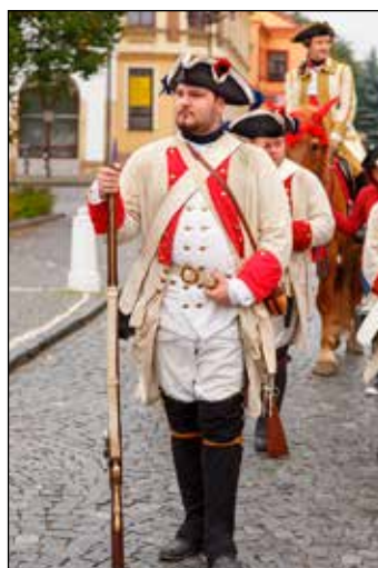
Pozor, pochodem vpřed.