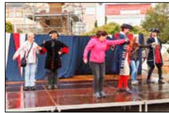
Svitavané si vše užili na „vlastní kůži“.