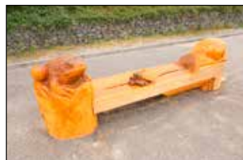
Petr Šteffan: A ploč?