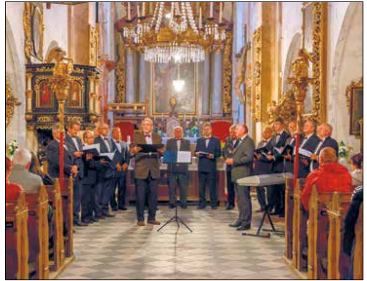
Komorní mužský pěvecký sbor městyse Jimramova.