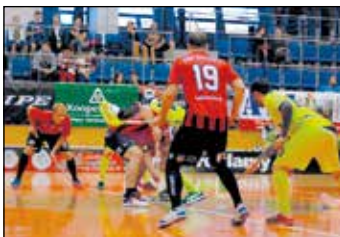
FbK Svitavy - Ostrava (3:5).