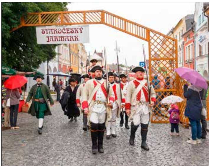
Ukázky dobového života v historickém ležení s dobovými stany, stylovým jarmarkem s historizujícím zbožím a řemesly.