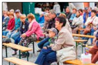
Diváky v chladném počasí zahřála dobrá muzika nejen na duši, ale i na těle.