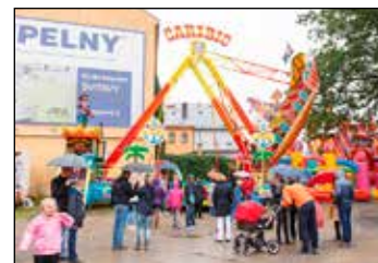
Tradiční poutové atrakce.