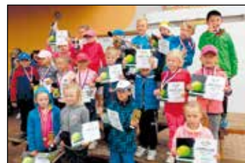
Naši mladí tenisté.