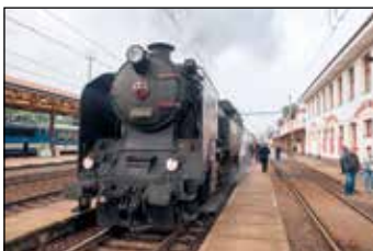
Výročí železnice a lokomotiva „ušatá“.