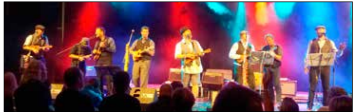
Zazněly největší hity napříč dosavadní kariérou známé zpěvačky. Po skončení koncertu vystoupila svitavská skupina SUE Ukulele Ensemble.