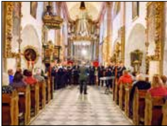
Unikátní místo s úžasnou akustikou. To je kostel sv. Jiljí.