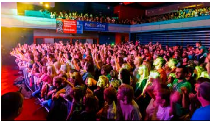
Kvůli nepříznivému počasí byl koncert přesunut z náměstí do Fabriky. Nenechalo si jej ujít několik stovek fanoušků, příští rok počasí určitě vyjde :)