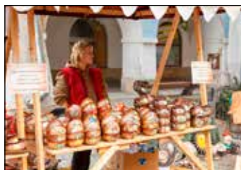
Návštěvníci poutě si mohli zakoupit hezký dárek v mnoha stáncích.