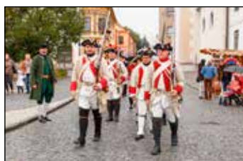
Vojáci Marie Terezie.