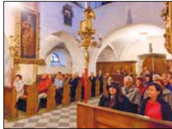
Kostel zaplněný posluchači.