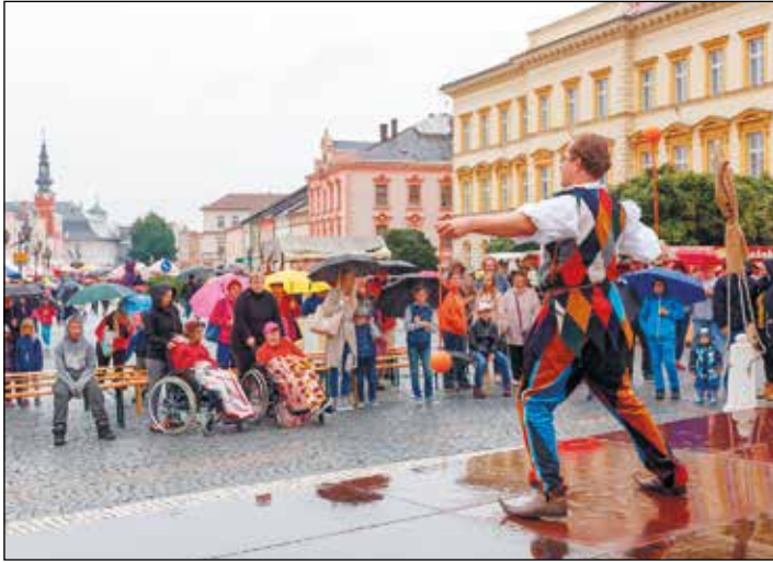
Yufiho sny - žonglér a kejkliř.