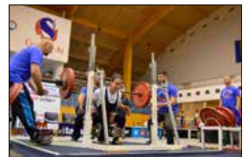
Tvrký sport nejen pro chlapy.