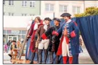
Skoro jako čtyři mušketýři.