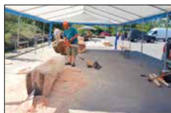
Motorové pily se nezastavily.