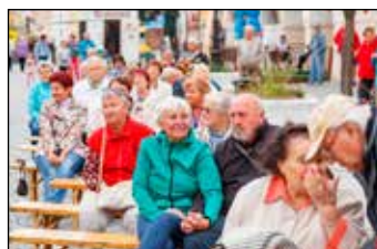
Příjemné odpoledne ve Svitavách.