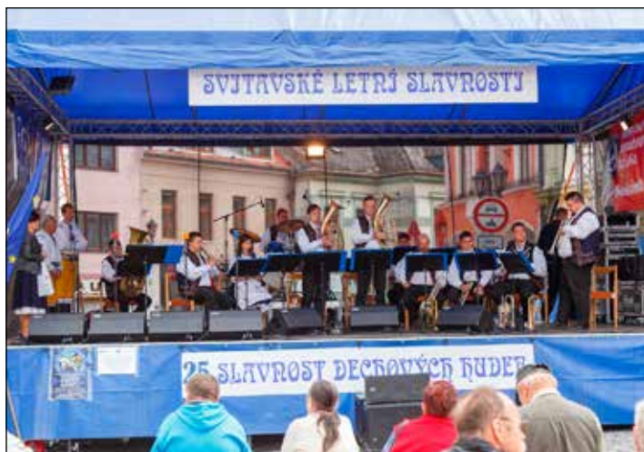
Během slavnosti vystoupilo na náměstí několik kapel.