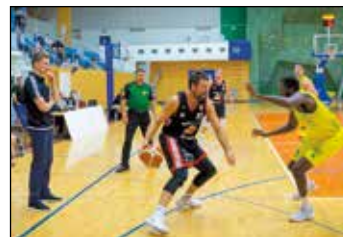
Tuří Svitavy - Levický Patrioti (77:62).