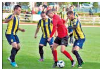
Zápas svitavského A týmu.