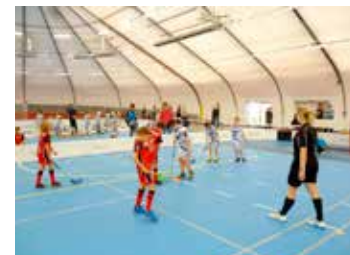
Florbal v hale Šapito.