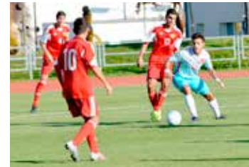
Turecko – Arménie (4:0)