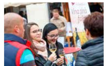
Jsmo rádi, že se ukázalo dobré srdce Svitavana i návštěvníků z okolních měst, kteří na náměstí přišli i za deště a dotvořili příjemnou atmosféru celé akce.