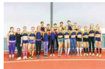
V rámci slavnostního programu závodily štafety atletických oddílů.