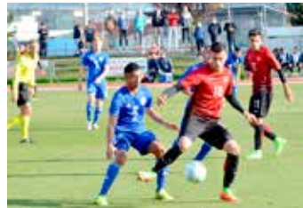
Turecko – Izrael (0:1)