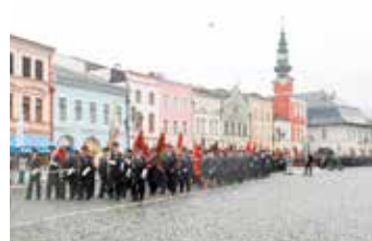
Prapory pochodovaly přes náměstí. Doprovodili je představitelé města a kraje.