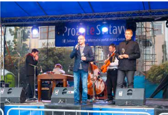
Zahájení Svatováclavského koštu přípitkem dobrého bílého :)