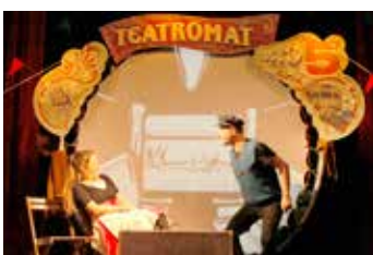
Malý abonentní cyklus.