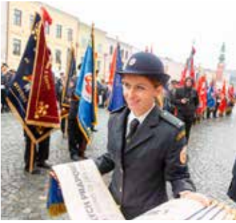
Půvabné ženy v uniformě.