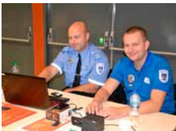
Na veletrhu sociálních služeb se představila i městská policie a koniči :)