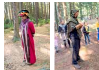
TOM zálesáci Svitavy a jejich přátelé již tradičně uspořádali kouzelné putování pro rodiny s dětmi v přírodním areálu Brand u rybníku Rosnička.