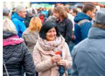
Komu byla zima, zvolil raději horký svařák, ale většinou to byla stejně klasika.