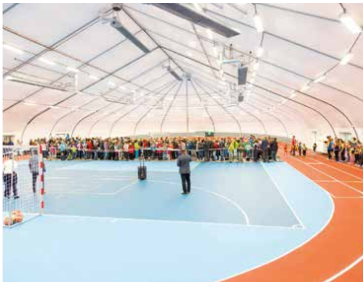
Velké množství návštěvníků se ve velké hale doslova ztratilo.