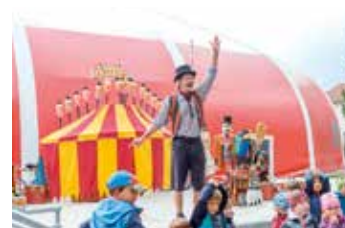
Když Šapito, tak cirkus!