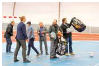
Ředitelé škol dostali malý dárek.