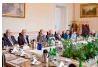
Jubilanti slavili na radnici.