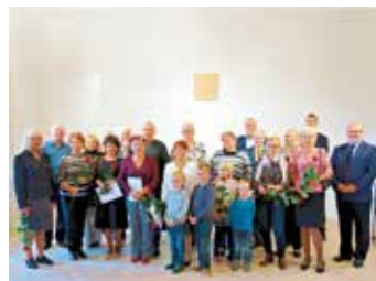
Slavnostní imatrikulace U3V.