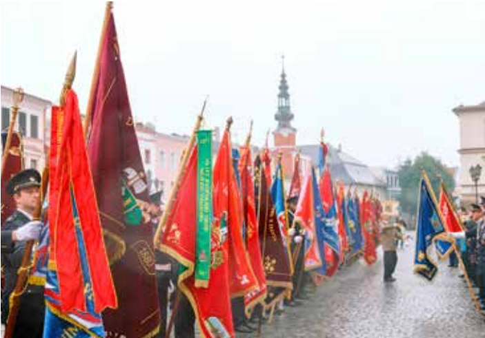
Barevná přehlídka téměř uměleckých výtvorů.