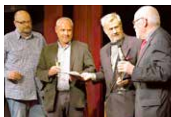
Křest knihy pověstí SVITAVY.