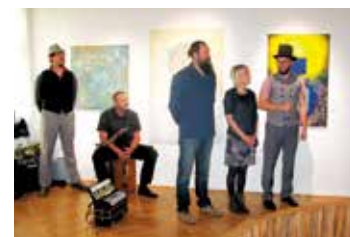
Vernisáž výstavy tří výtvarníků v muzeu.