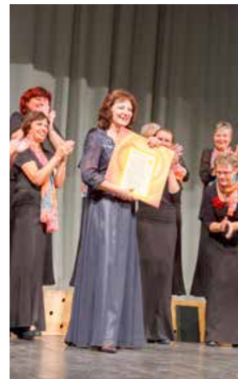
K narozeninám patří dárky.