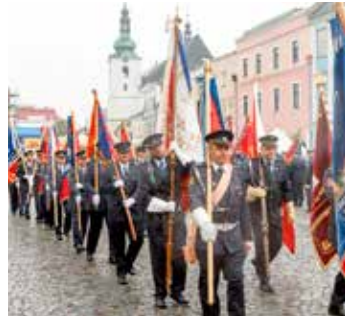
Slavnostní pochod doprovázela svitavská dechová hudba.