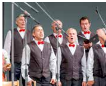
Sekce tenorů a basů.