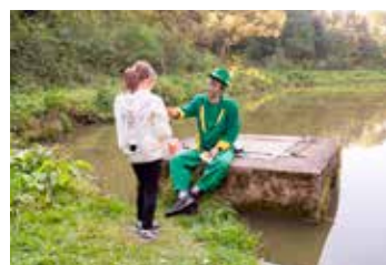
Na mokrý šos to moc nevypadá :)