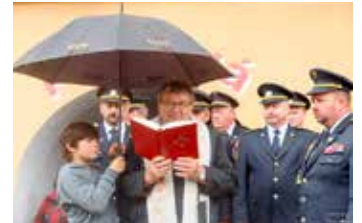
Žehnání proběhlo v dešti.