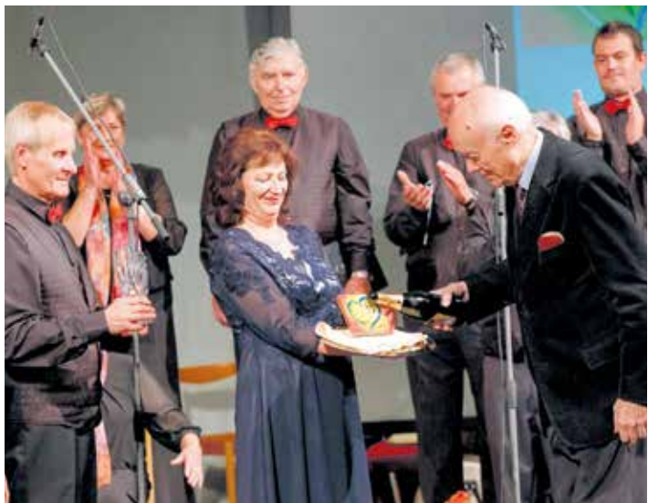
Slavnostní křest nového CD.