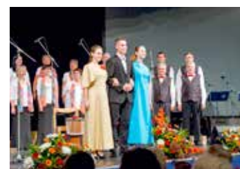
Natěšení diváci a část pěveckého sboru Dalibor, který se předvedl v několika variantách oblečení a představil i historické kostýmy.