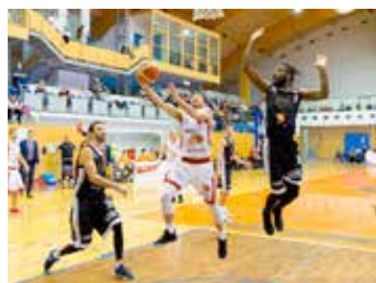
Tuři Svitavy - Nymburk.