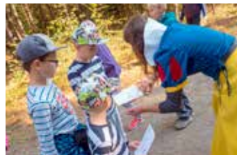
Sněhurka, mimoňové a další kouzelné bytosti v pohádkovém lese.