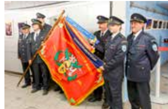
Jeden z dvaasedmdesáti praporů.