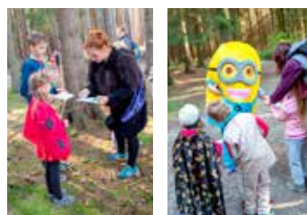
Pavouček a mimoň v akci. Děti si slunečné odpoledne báječně užily.