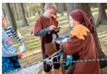
Máš splněno? Dostaneš razítko!