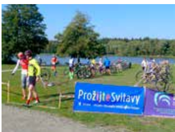
MTB duatlon Rosna.