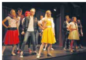
Muzikál gymnazistů Letní láska.