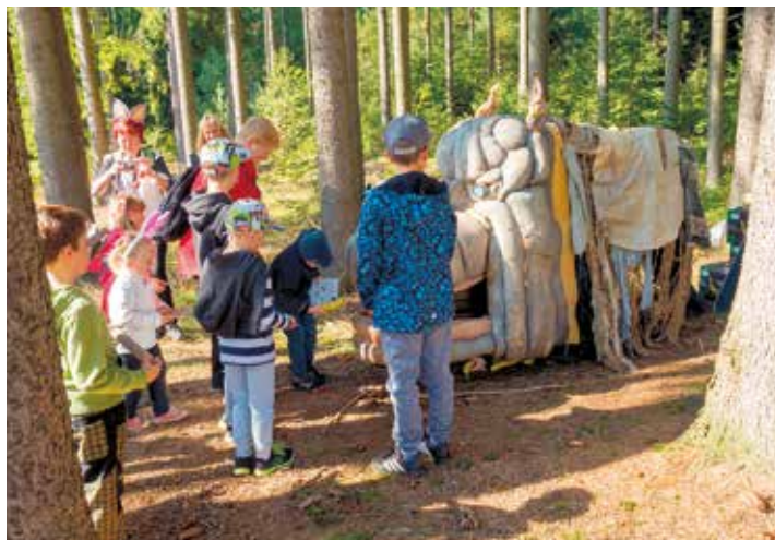
Nevíme, jaké je to kouzlo, ale vydává to banány! :)