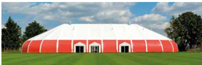
Pro svůj vzhled získala nová hala název Šapito.