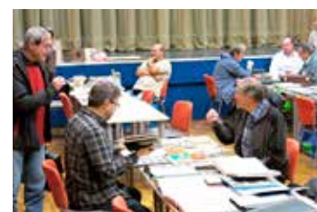
Sběratelská burza ve Fabrice.