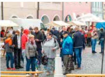
Milovníky vína i burčáku čekala pestrá nabídka od devíti menších vinařství.