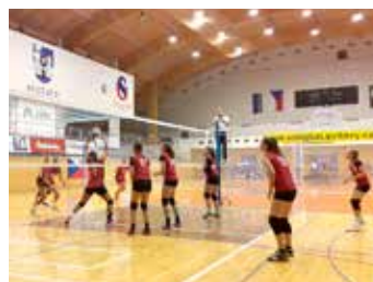
Naše volejbalistky v ostrém zápase.