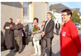
Otevření provozu Charity Svitavy.