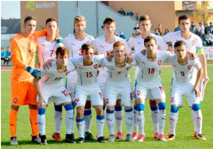
Česká republika – Turecko (1:1)