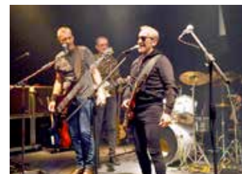
Kapela Syfon a přátelé v Tyjátru.