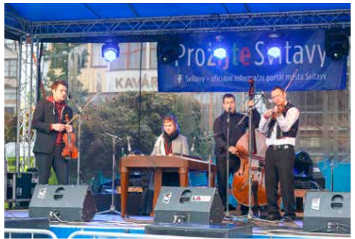
K dobrému pití dobrá cimbálová muzika a místo sklípku naše náměstí.