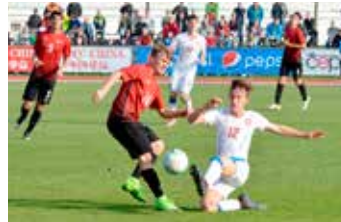
Zápas živě sledovalo 700 diváků. Oslava postupu do další fáze kvalifikace.