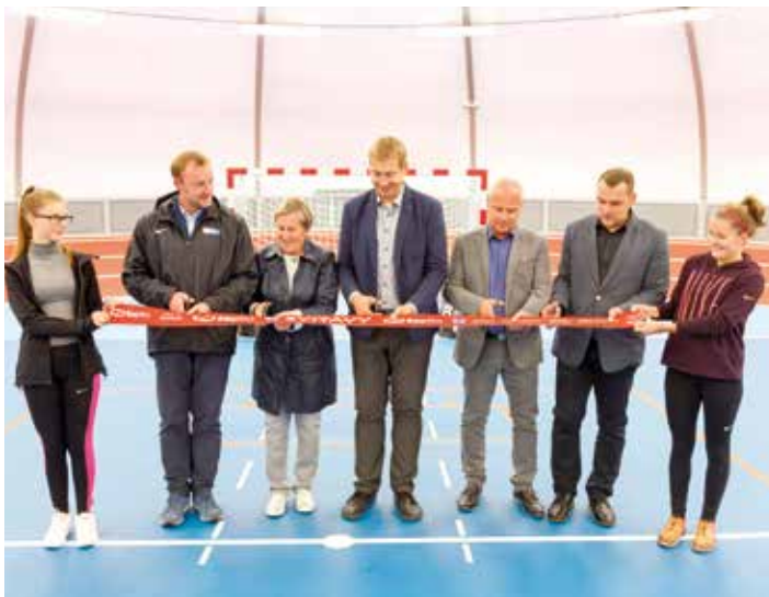
Střihání pásky a oficiální zahájení provozu centrální tělocvičny.