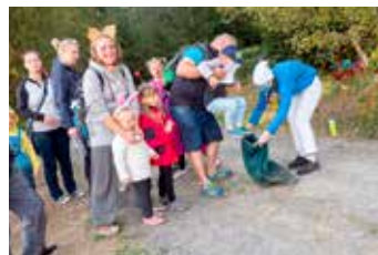
Šup a je to v pytlí.