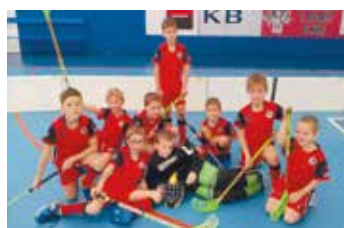
Nejmladší hráči přípravy FbK Svitavy.