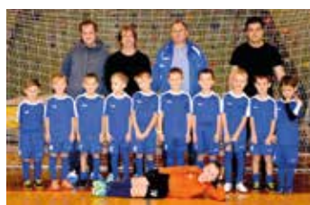
Přípravka vyhrála na domácím turnaji.