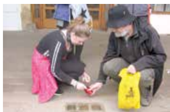
Uložení dalšího z Kamenů zmizelých, který je součástí projektu Hledání hvězdy Davidovy – poselství lidskosti.