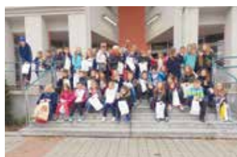
Návštěva žáků z partnerské ZŠ Janusza Korczaka v Ladku-Zdroju.