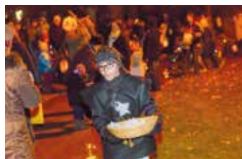
V parku si mohly děti zasoutěžit a zažít tak noční dobrodružství.