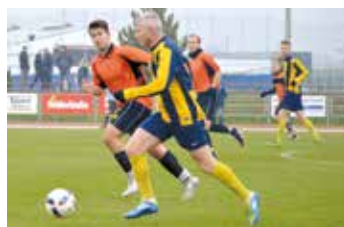
TJ Svitavy - Litomyšl (1:1 / 7:6).