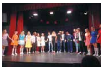
Letní láska v Divadle Trám.