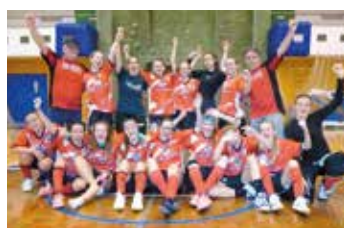
Dorostenky FbK Svitavy - Vrchlabí (3:2).