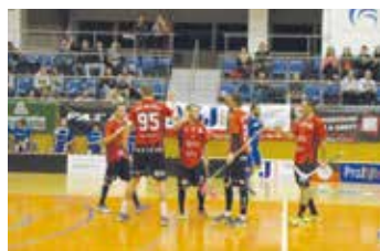
FbK TJ Svitavy - Pelhřimov (7:5).