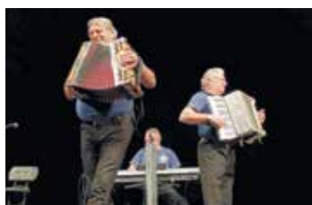
Veselá trojka ve Fabrice.