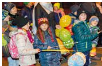
Je dobré si na cestu posvítit.