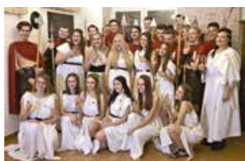
Stužkování maturantů gymnázia.