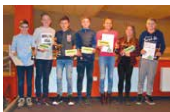
Tenisový oddíl vyhlásil na bowlingu nejlepší hráče v anketě Zlatý kanár.