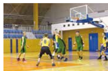
Turnaj O pohár 17. listopadu.