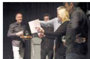
Křest knihy Jak postavit železnici.