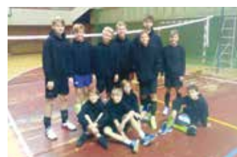
Žáci v první osmičce Českého poháru.