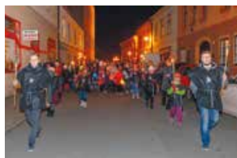
Začátkem listopadu se vydali Svitavané z náměstí do parku Jana Palacha v průvodu za sv. Martinem.