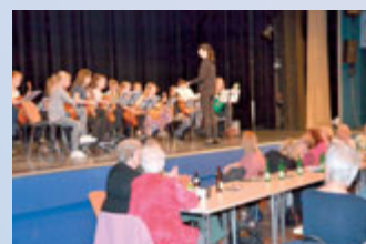
Schůze Sdružení pro civilizační choroby.