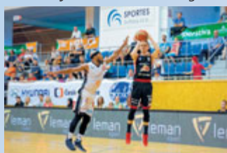
Tuří Svitavy v semifinále s Nymburkem.