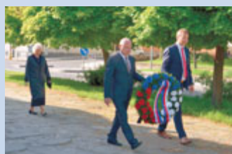
Pietní akt – Den vítězství.