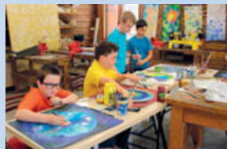
Workshop v muzejních dílnách.