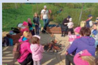
MC Krůček - čarodějnice na nečisto.