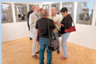
Národní výstava amatérské fotografie.