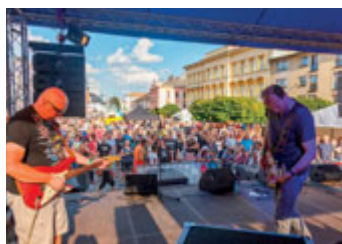
Nechyběla dobrá muzika.