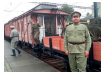
Muzeum na kolejích Legioplak.