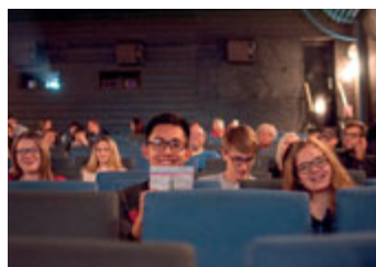
Festival Svitavská klapka.