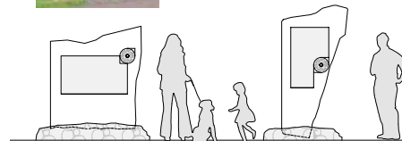
TABLE IV - DRUHOOHORY plošný 1:25