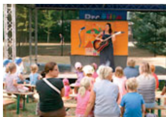
Hudební pohádky v parku.