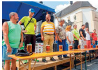
Tradiční soutěžní klání.