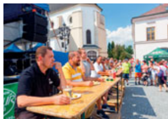
Během akce se předvedli také jedlíci.