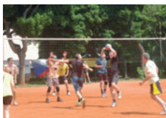
Volejbalový turnaj generací.