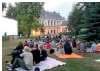
Plné letní kino :)