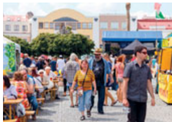
Svitaváci se dobře bavili :)