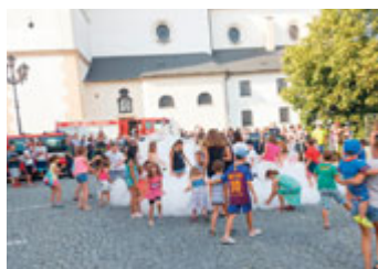
Pivní pěna pro děti.