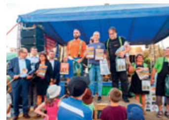
„Gulášoví“ vítězové :)