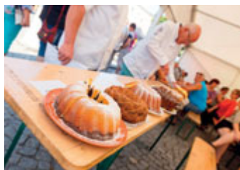
Soutěž o nejlepší bábovku!