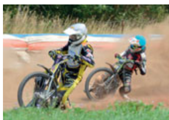
Plochá dráha Speedway.