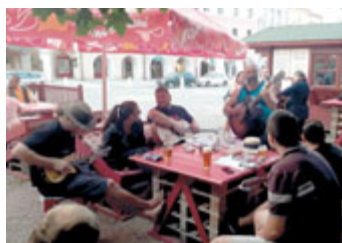
Večer s kytarou u Floriánky.