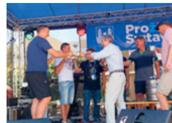
Zahájení pivních slavností.