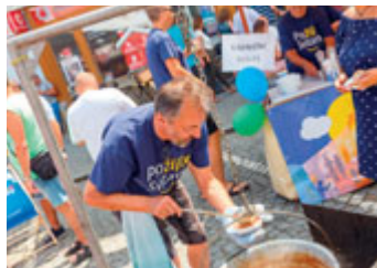
Soutěžní vzorek radničního guláše.