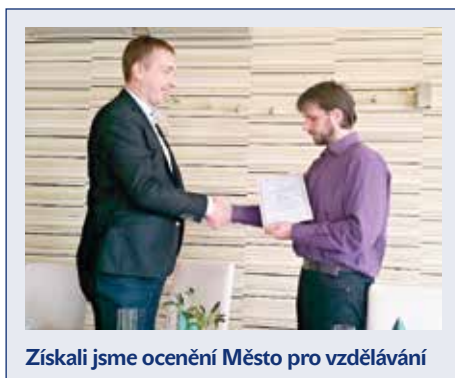
Získali jsme ocenění Město pro vzdělávání

Investice v cekové výši 228 821 tis. Kč, z toho dotace 81 254 tis. Kč