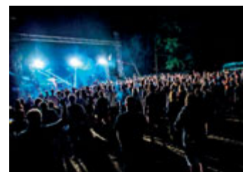
Rosnička - festival současnosti.