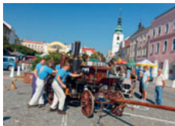
Výstava historických vozidel proběhla ve spodní části náměstí. K vidění byla spousta nádherných strojů.