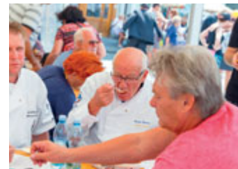
Porotci v akci.