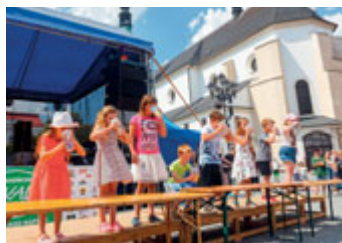
Děti popíjely z nových kelímků.