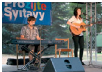
Písničkáři se sešli a zahráli v parku Jana Palacha.