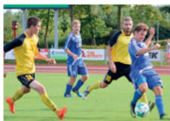
TJ Svitavy – FK Letohrad 1:5.