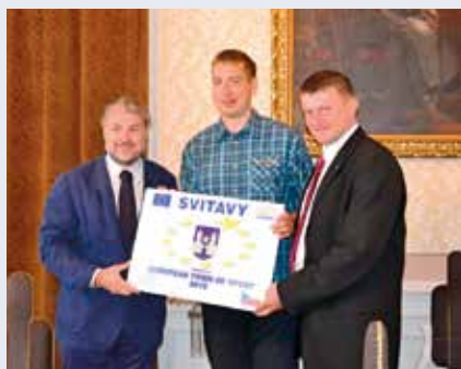
Získali jsme ocenění Evropské město sportu

Celková částka 42 059 tis. Kč, z toho dotace 28 760 tis. Kč