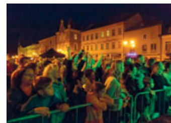
Na svitavském náměstí vystoupil známý zpěvák Michal Hrůza se svojí kapelou Hrůzy. A hrůza to nebyla, Svitaváci se dobře bavili :)