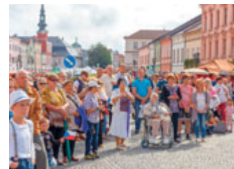
Během zářijové pouti ke sv. Jiljí vystoupily historické skupiny v rámci programu k oslavám 100. výročí založení naší republiky.