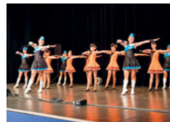
Program byl připraven i pro naše seniory a fanoušky dechové hudby. V sále Fabriky se představily i mažoretky se svojí sestavou.