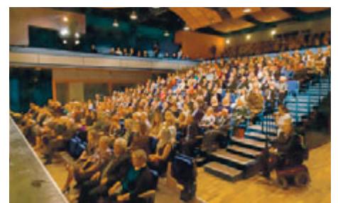
Divadelní představení ve Fabrice. Prodaná nevěsta na prknech Prozatímního, Stavovského a Národního divadla v letech 1868 až 2018.