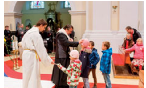
V neděli ráno proběhla na náměstí v kostelu Navštívení Panny Marie ekumenická bohoslužba svitavských církví.