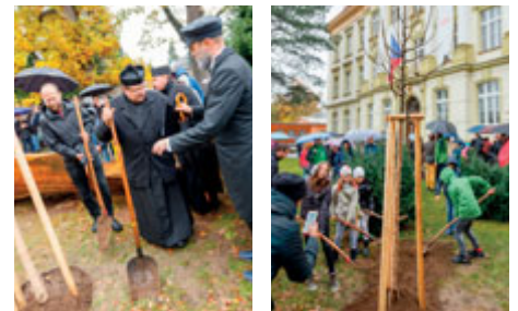
V parčíku před základní školou T. G. Masaryka byl vysazen národní strom lípa malolistá. To si nenechal ujít ani náš první prezident Masaryk!