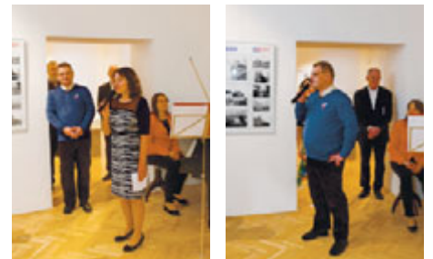
Vernisáž výstavy Svitavské osmy. Virtuální procházka dějinami města po rocích, které končily osmičkou a sehrály v dějinách města nějakou roli.