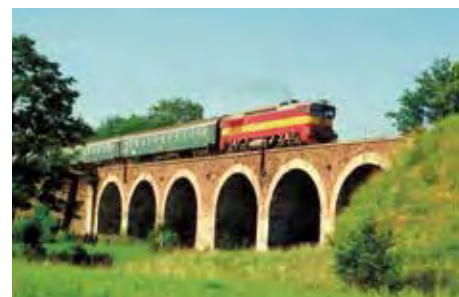
Na viaduktu v Hradci nad Svitavou roku 1995 jede rychlík R 680 v čele s lokomotivou 754.041.