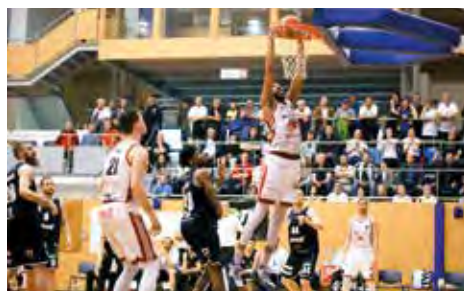
Tuři Svitavy - BK ARMEX Děčín.