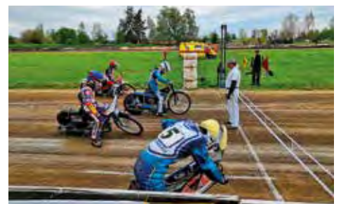
Plochá dráha Speedway Svitavy.