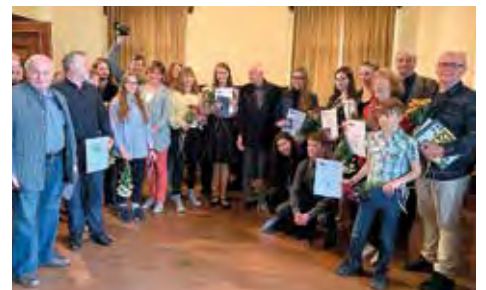
39. ročník Národní soutěže a výstavy amatérské fotografie, zahájení výstavy v městském muzeu a výstava na šňůrách.