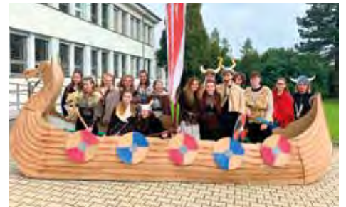
Studenti oslavili svůj svátek tradičním pochodem v maskách a dalším programem v parku Jana Palacha a na Lánské zahradě.