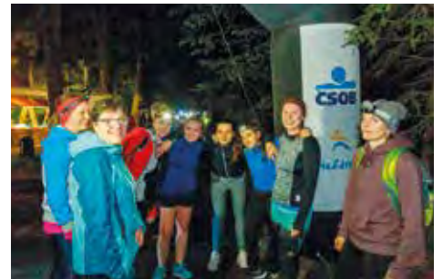
Svitavané, děkujeme! Předvedli jsme se v plné parádě. Běhu pro Světlušku se zúčastnilo přes 600 běžců!