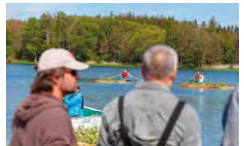
Veřejnost se zapojila do programu regenerace rybníku Rosnička, místní patrioti společně vysázeli první z plovoucích ostrůvků.