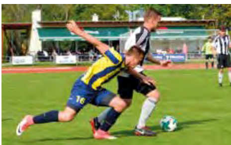
TJ Svitavy A - Holice 1:0 (krajský přebor).