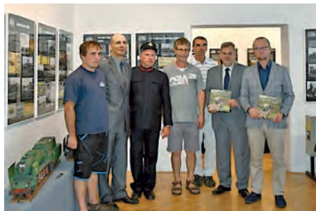
Autoři publikace s krajským hejtmánem