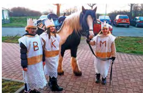
Konec roku jsme společně oslavili tradičním ohňostrojem a čočkovkou :-). Začátek toho nového patřil Třem králům – průvodu i sbírce.